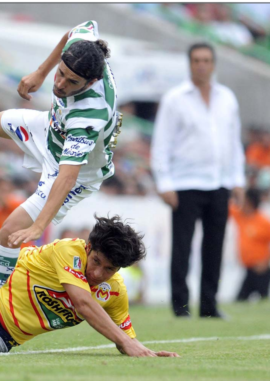
de Santos, durante el encuentro de vuelta de las semifinales del torneo Bicentenario 2010 celebrado en el estadio Corona de

Los del Morelia, que dirige el mexicano Tomás Boy, se levantaron del primer gol y empataron 1-1 (4-4 global) con gol del colombiano Luis Gabriel Rey (minuto 5), de penal, pero sucumbieron ante el poderío ofensivo del equipo del Santos.