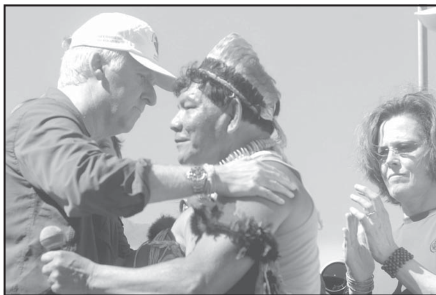
BRASILIA (BRASIL). El director de cine, James Cameron (izqda.), y la actriz estadounidense Sigourney Weaver (dcha.), saludan a un indígena brasileño de la región del río Xingú, durante un acto celebrado ante la sede de la Agencia Nacional de Energía Eléctrica (Aneel) en Brasilia. Cameron, director de la taquillera película “Avatar”, se comprometió a “difundir en el mundo” el rechazo de indígenas y campesinos a la construcción de la que sería la tercera mayor hidroeléctrica del mundo en la Amazonía brasileña.

Cameron, junto a Sigourney Weaver y Joel David Moore, dos de los protagonistas de “Avatar”, participaron en la clausura de la protesta, que antes de llegar a la sede de la Aneel habían recorrido avenidas de