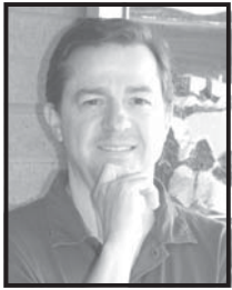
Por Javier Sierra

Poderoso caballero es Don Dinero y la Corte Suprema de Justicia lo acaba de hacer aún más poderoso. De un plumazo, la corte más conservadora en 100 años sacudió los cimientos de la democracia permitiendo a las corporaciones gastar tanto dinero como gusten para apoyar u oponerse a un determinado candidato electoral.