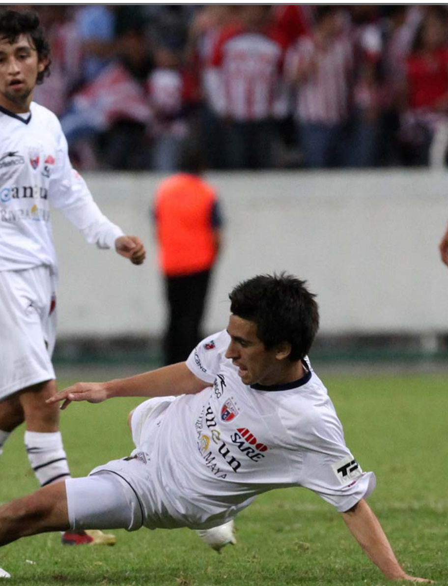
(abajo) del Atlante, durante un partido por el Torneo Bicentenario 2010 que se realizó en el estadio Jalisco de