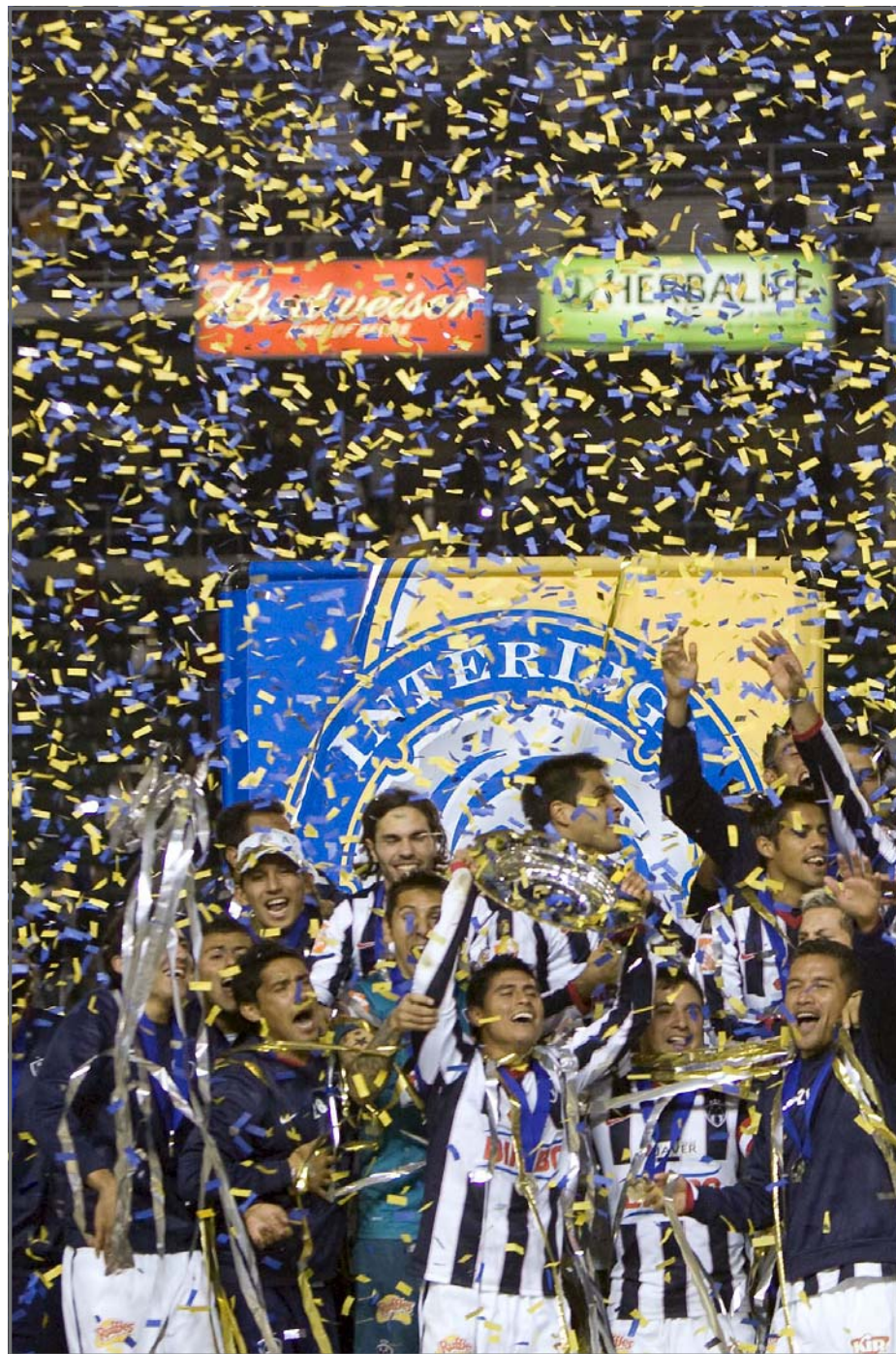
CARSON (CA, EEUU). Los jugadores del Monterrey celebran su victoria frente al Club América tras la tanda de penales, en part...

"frustración" de la derrota y la obligación de superarla haciendo una gran labor en torneo local Bicentenario 2010, mientras que Monterrey pasó a formar parte del Grupo 2 del torneo continental junto al Sao Paulo de Brasil, Nacional de Paraguay y el Once Caldas de Colombia. El América nada más concluir el partido viajó de regreso a la Ciudad de México para comenzar la preparación de cara al partidos de liga local, después de haber permanecido