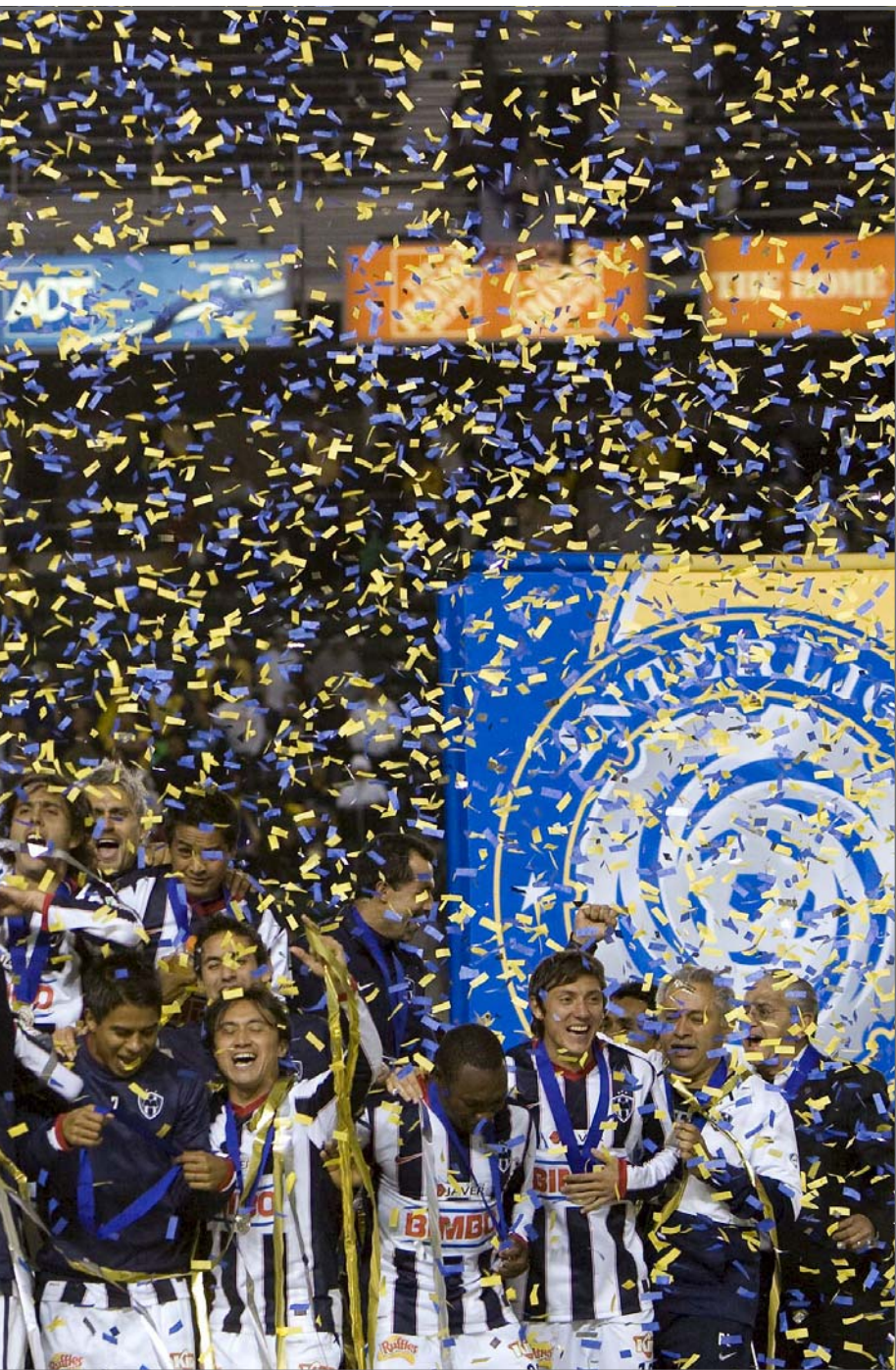
ido correspondiente a la Interliga 2010, jugado en el Home Depot Center, en Carson, California.

marcador adverso de 0-2. Si superan al Juan Aurich, Estudiantes Tecos entrará en la fase de grupos para irse al 3 y enfrentarse a los equipos de Alianza de Lima de Perú, Bolívar de Bolivia y Estudiantes de la Plata de Argentina.