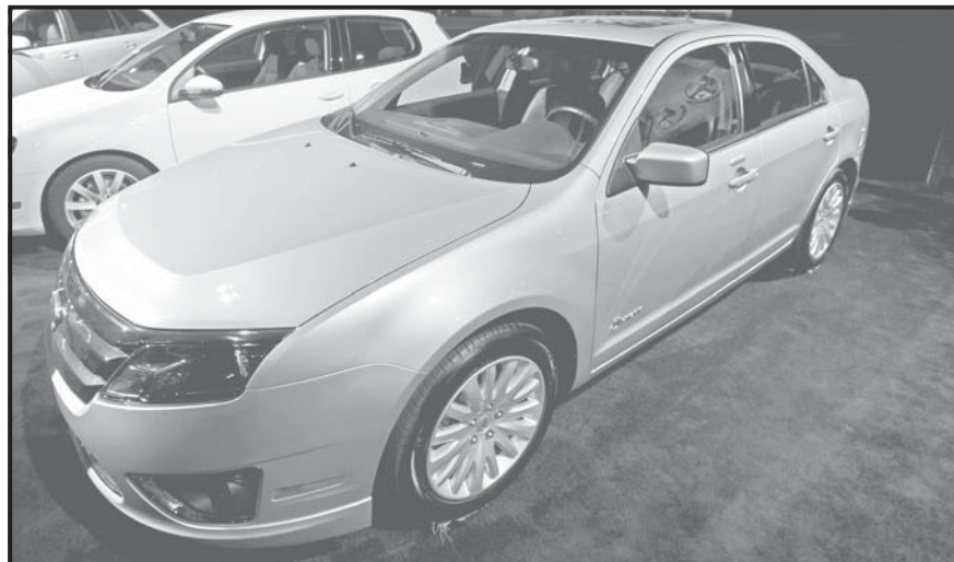
DETROIT (ESTADOS UNIDOS). Un coche modelo Ford Fusion Híbrido, elegido Coche Norteamericano del Año, expuesto en el Salón del Motor de Detroit. El Salón del Motor de Detroit presenta en esta edición cerca de 60 nuevos modelos.

El CH es unos 55 centímetros más corto que el Prius y ligeramente más estrecho. Toyota expresó que el prototipo es fruto de las demandas de concesionarios y consumidores, y está destinado a captar jóvenes conductores con un presupuesto