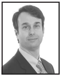
Por Jason Alderman

Una pequeña perspectiva esperanzadora de la reciente caída económica es que la gente ha comenzado a ahorrar de nuevo. Por décadas, las tasas de ahorros personales rondaban sobre el 10 por ciento después de impuestos sobre la renta, pero a partir de finales de 1980, las tasas disminuyeron sostenidamente.