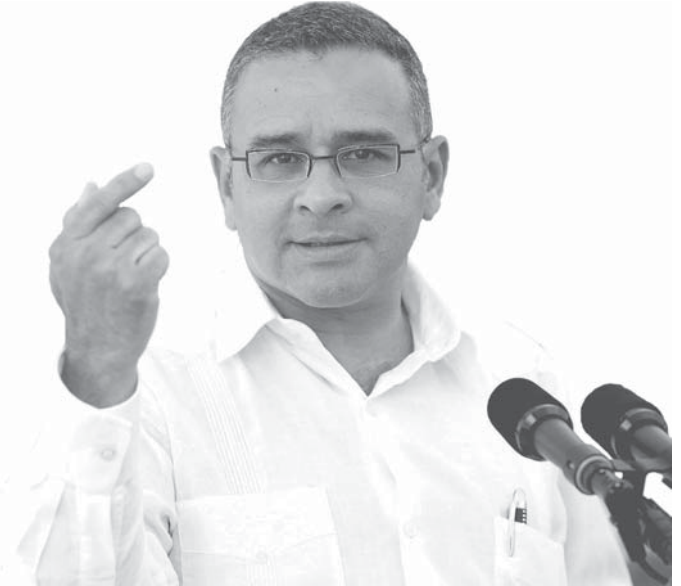
CONCEPCIÓN QUEZALTEPEQUE (EL SALVADOR). El presidente salvadoreño, Mauricio Funes, habla durante un acto en el municipio de Concepción Quezaltepeque (El Salvador), donde anunció que entregará desde noviembre próximo un subsidio de 50 dólares mensuales a ancianos que no cuentan con una pensión en el Seguro Social.

Las remesas, que son una de las principales entradas de la economía salvadoreña, han caído un 10.8 por ciento en el primer semestre del año, mientras que en el mismo periodo las exportaciones disminuyeron un 17 por ciento y las importaciones un 28.7 por ciento.