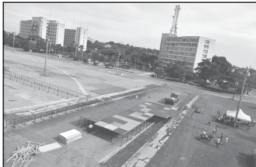
LA HABANA (CUBA). Vista general de la construcción del escenario para el concierto “Paz Sin Fronteras” que el músico colombiano Juanes y otros cantantes y grupos ofrecerán en la Plaza de la Revolución de La Habana (Cuba). La plataforma se construye en el mismo sitio frente a la Biblioteca Nacional donde el Papa Juan Pablo II ofició su misa durante la visita que realizó en 1998.