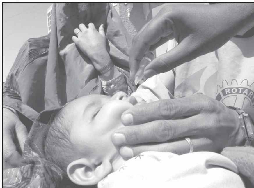
CHAMÁN (PAKISTÁN). Un empleado de Sanidad administra la vacuna de la polio a un bebé en Chamán en Pakistán. Millones de niños de menos de cinco años reciben dosis contra la polio en diferentes momentos del año como parte de la campaña de vacunación del gobierno paquistaní para erradicar la enfermedad. La mortalidad infantil se redujo en el mundo gracias a políticas sanitarias como la vacunación.

“Es inaceptable que 8.8 millones de niños fallezcan antes de su quinto cumpleaños”, dijo la directora ejecutiva de Unicef, Ann Veneman.