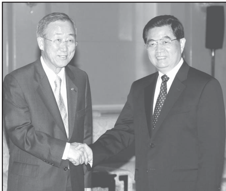
PEKÍN (CHINA). El Secretario General de la Organización de las Naciones Unidas, Ban Ki-moon, estrecha la mano del presidente chino, Hu Jintao, en Pekín, China. Ban destacó en la capital china que no será posible un nuevo acuerdo internacional en la cumbre de diciembre en Copenhague sobre el cambio climático sin la cooperación de este país asiático.

Ban expresó que el presidente chino, Hu Jintao, y el primer ministro, Wen Jiabao, reafirmaron la voluntad de su gobierno de “sellar un pacto” en la conferencia internacional en Copenhague. La negativa de economías emergentes, como China o India, a comprometerse con las reducciones de emisiones constituye uno de los principales obstáculos para poder alcanzar un acuerdo global en la capital danesa. Los gobiernos occidentales consideran que sin la participación de los gigantes asiáticos carece de sentido combatir el cambio climático, mientras que China e India sostienen que no sacrificarán su desarrollo económico para combatir un problema que atribuyen a los países desarrollados. ●