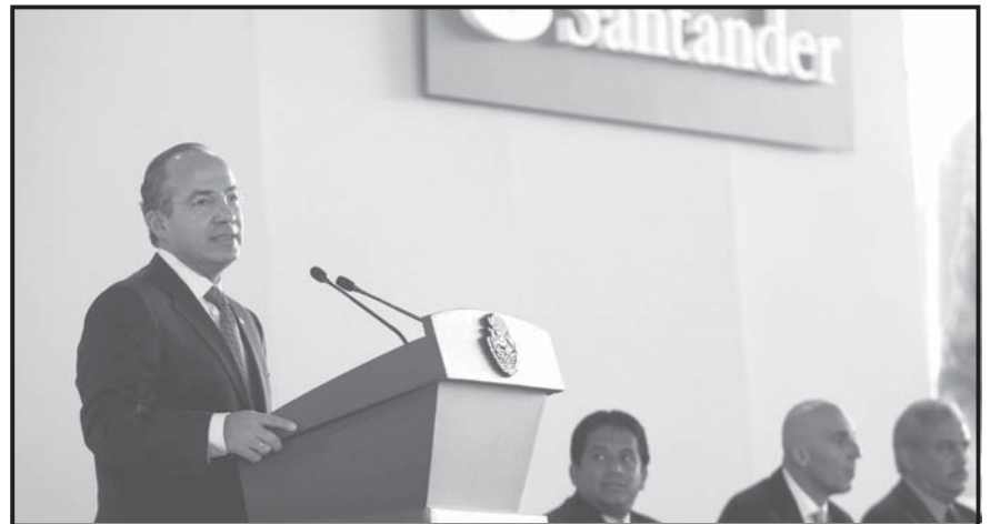
QUERÉTARO (MÉXICO). El presidente de México, Felipe Calderón (izqda.), habla durante la inauguración del centro de contacto y servicio a clientes de Santander, que implicó una inversión de 2500 millones de pesos (188 millones de dólares) y desde el cual 6000 empleados darán atención remota a clientes de varios países de América y Europa. Estas inversiones ayudan en plena crisis en la generación de empleo.

Ruiz Mateos recordó que en diciembre pasado México, junto con Estados Unidos, demandó a China por subsidios de origen.