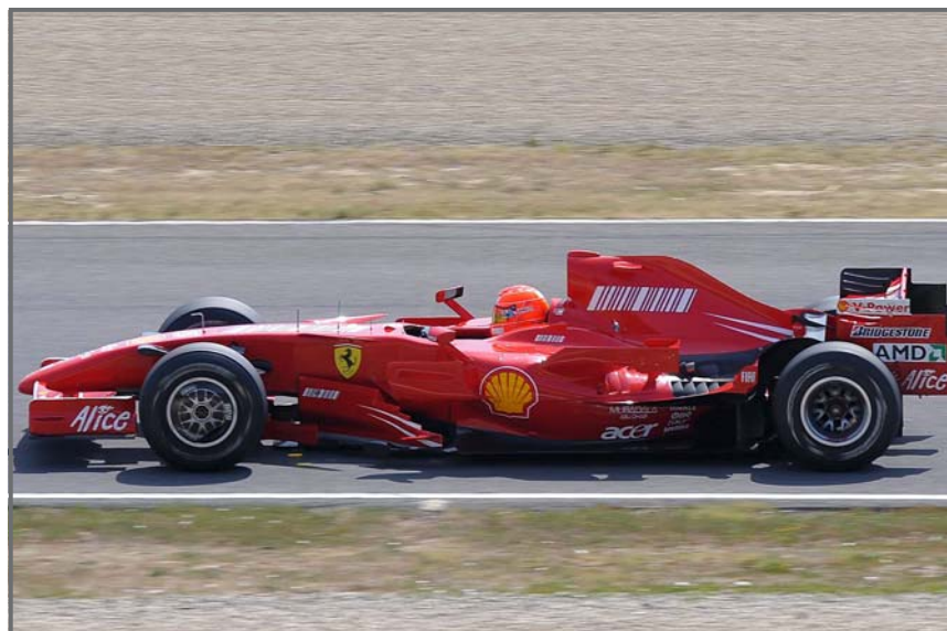
MUGELLO (ITALIA). El piloto alemán de Fórmula 1, Michael Shumacher, prueba el Ferrari F2007 en el circuito de Mugello, Italia. El siete veces campeón mundial prepara su vuelta a los circuitos para disputar el Gran Premio de Valencia el 23 de agosto. Schumacher sustituirá al brasileño Felipe Massa al sufrir este último un accidente en el Gran Premio de Hungría.

El piloto brasileño Massa -al que sustituirá el campeón- sufrió un accidente durante la segunda ronda de clasificación para el Gran Premio de Hungría en el Hungaroring, debido a un fuerte impacto en la cabeza, de un muelle desprendido desde el Brawn de su compatriota Rubens Barrichello. Massa perdió momentáneamente el conocimiento, pero pudo frenar antes de estrellarse contra las protecciones del circuito a una velocidad 190 km/h.