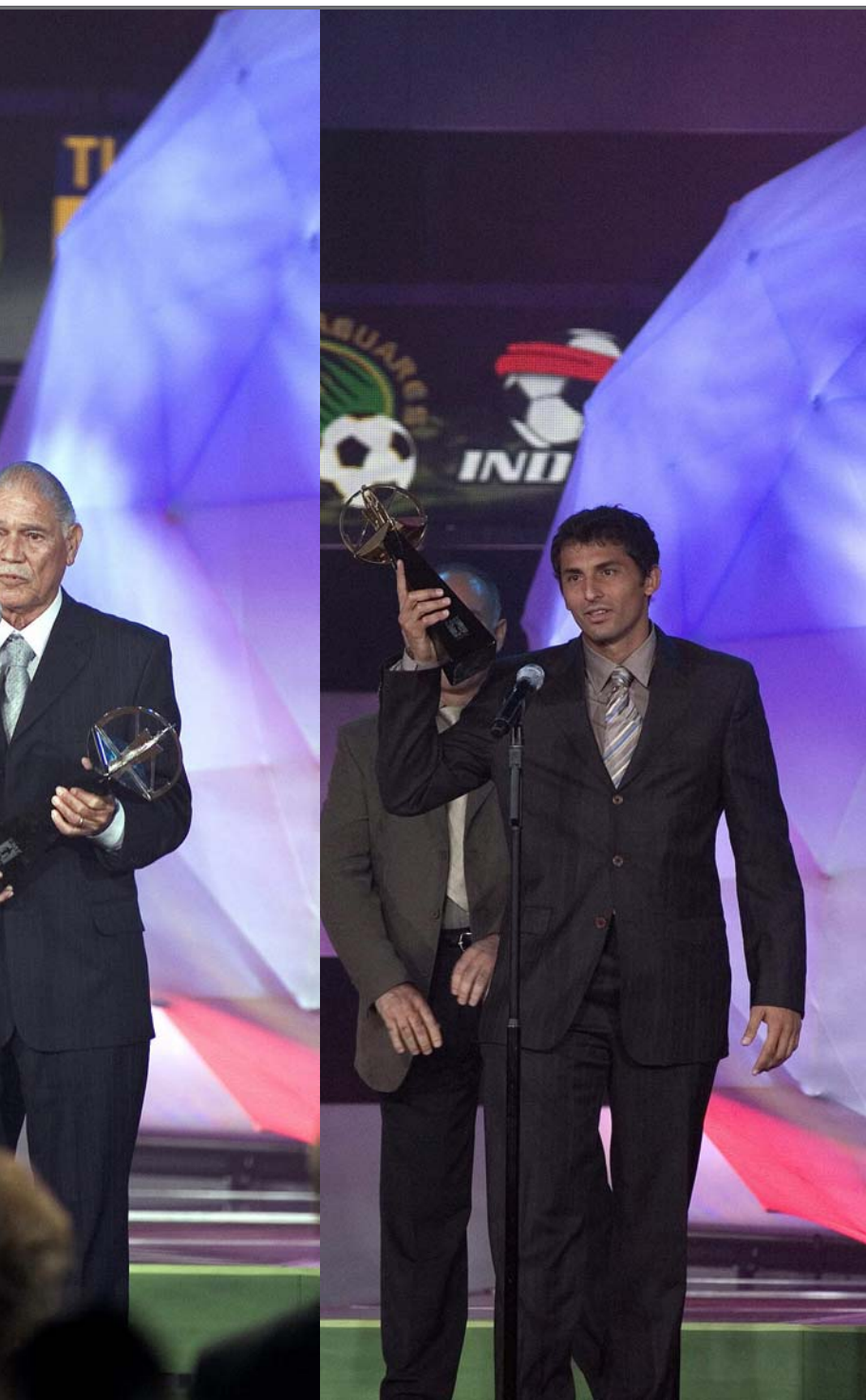
...ti, agradece al recibir el trofeo del "Balón de Oro". En el centro, el ex jugador de las Chivas Guadalajara Salvador Reyes Michel agradece al recibir el trofeo del "Balón de Oro". El "Balón de Oro" es un reconocimiento con el que la Federación

más gente hubiera votado por nuestros jugadores pero nos vamos contentos, no hay ningún problema".