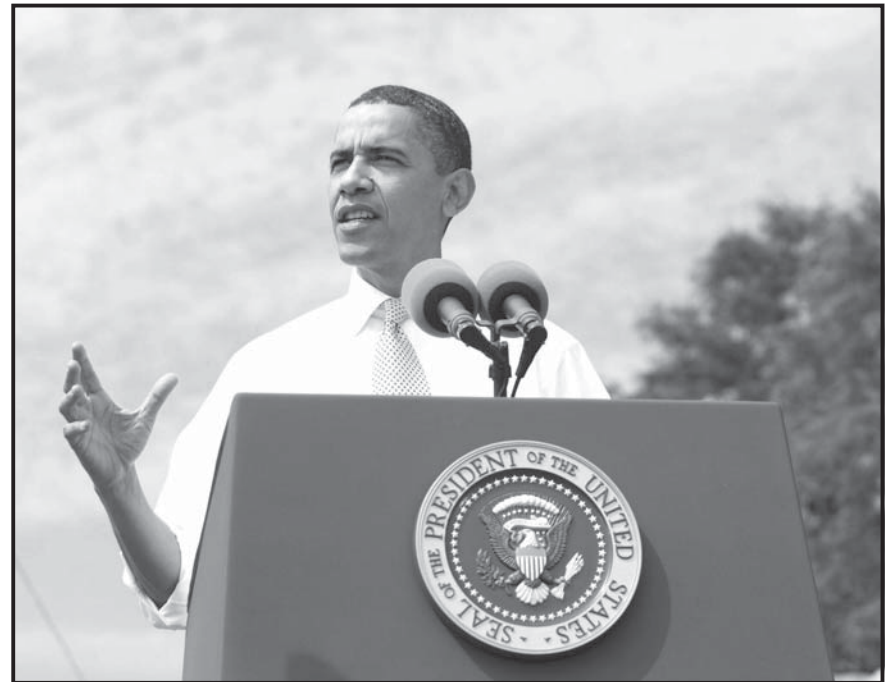
WARREN (MI, EE.UU.).- El presidente de Estados Unidos, Barack Obama, pronuncia un discurso en el Macomb Community College de Warren, Michigan. Obama ha expresado que se está saliendo de la crisis y que “en poco más de 100 días la ley de recuperación económica ha dado los resultados previstos”.

El presidente advirtió de que a pesar de estar saliendo de la crisis si no se aplican