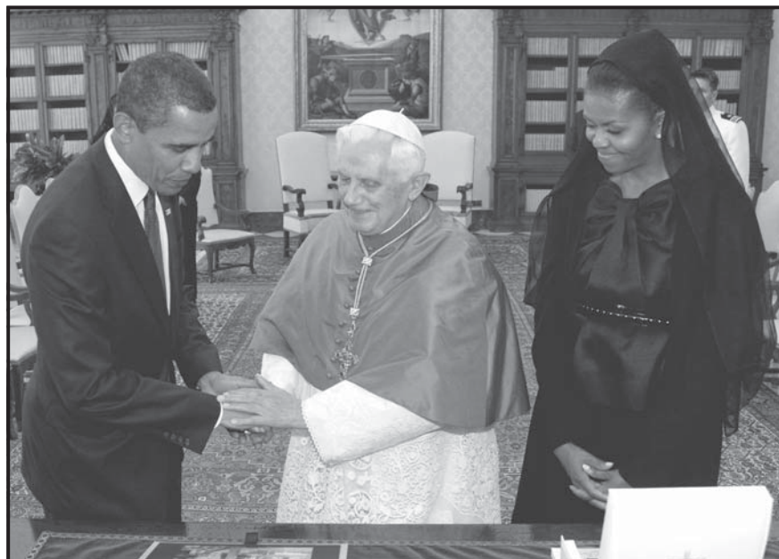
CIUDAD DEL VATICANO (VATICANO). El Papa Benedicto XVI (centro) recibe al presidente de Estados Unidos, Barack Obama (izqda.), y a la primera dama, Michelle Obama (dcha.), en la biblioteca privada del pontífice en Ciudad del Vaticano. Barack Obama, llegó al Vaticano para entrevistarse con Benedicto XVI, en su primera reunión con el Papa y con la que concluye su visita a Italia donde asistió a la cumbre del G-8.

Benedicto XVI recibió en el Vaticano al primer ministro de Canadá, Stephen Harper, con quien analizó los resultados de la cumbre del G-8 celebrada en L'Aquila (centro de Italia), donde se abordaron temas como: la crisis económica, la ayuda a África, el cambio