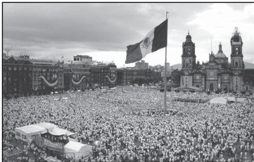
CIUDAD DE MÉXICO (MÉXICO). Decenas de miles de mexicanos vestidos con prendas blancas se reúnen en el Zócalo de la Ciudad de México, durante la marcha para demandar un cese a la violencia por parte de la delincuencia organizada. La ola de violencia que vive el país afecta a varios de sus estados y suma más de 2657 asesinatos en lo que va de éste año.