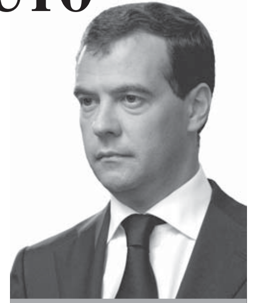
SOCHI (RUSIA). El presidente ruso, Dmitry Medvedev, durante un discurso en la residencia Bocharov Ruchei en Sochi, Rusia. Medvédev, anunció que Rusia reconoce la independencia de las regiones separatistas georgianas de Osetia del Sur y Abjasia. El jefe del Kremlin informó de que ha firmado los decretos sobre el reconocimiento por Rusia de la independencia de ambas regiones georgianas e instó a otros Estados a seguir su ejemplo y hacer lo mismo.

Desde la ampliación de 2004, las relaciones de la UE con Rusia se han complicado por la desconfianza histórica que las repúblicas bálticas (antiguos miembros de la URSS ocupados por Stalin en 1940) o los países que se mantuvieron contra su voluntad en la espera soviética (como Polonia, República Checa o Hungría), y por la política exterior de Rusia, especialmente hacia