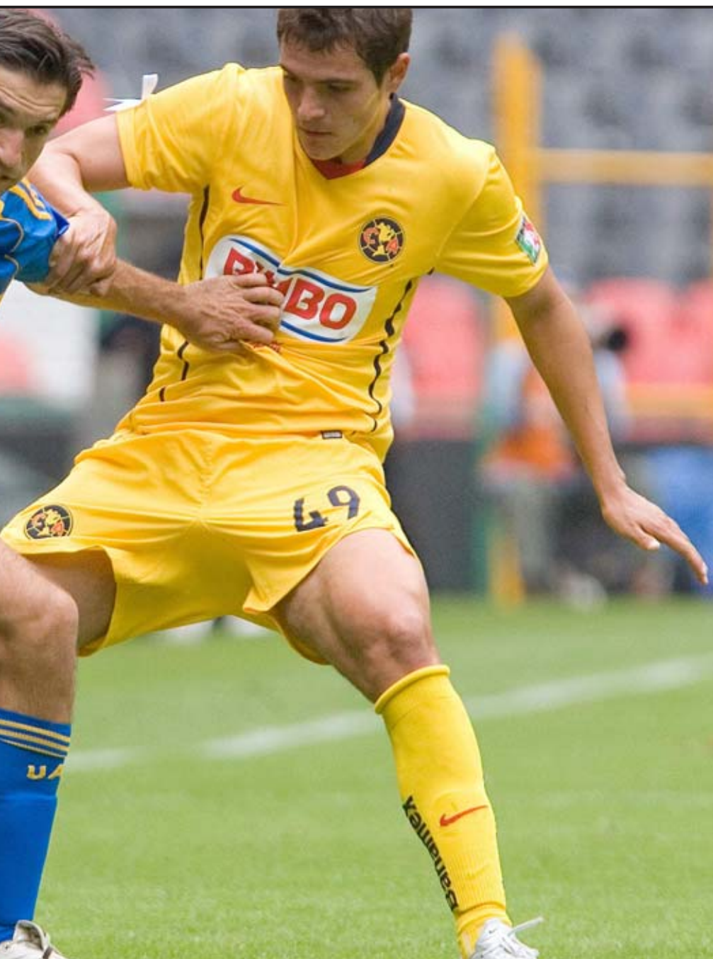
a.) de Tigres durante el partido correspondiente a la séptima jornada del Torneo Apertura 2008 que se disputa en el estadio Azteca de

Ferretti, golearon 3-0 al Atlas, gracias a la gran actuación de Juan Carlos Cacho quien marcó tres goles, mientras que el Cruz Azul venció 2-1 al Necaxa, con goles de los paraguayos Pablo Zeballos (minuto 54) y Christian Riveros (minuto 77). El descuento del Necaxa lo marcó el colombiano Hugo Rodallega (minuto 58) y se ratificó como líder de goleo, con seis dianas en siete encuentros.