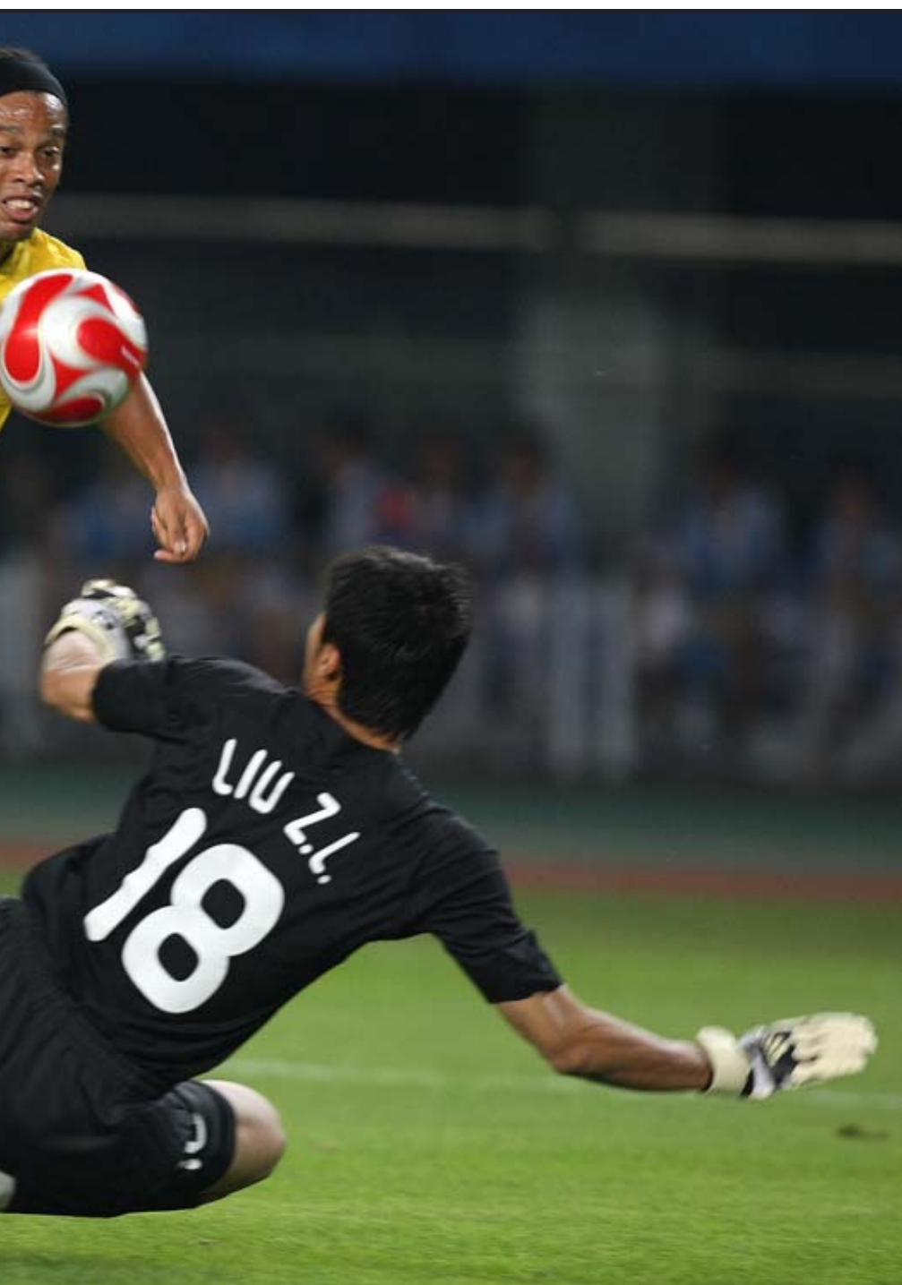
(dcha.) durante el partido de la ronda clasificatoria a cuartos de final de los Juegos Olímpicos de Pekín.