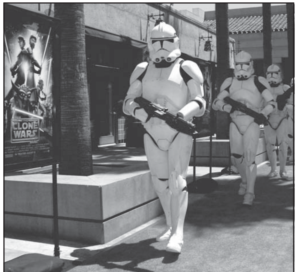
LOS ÁNGELES (EEUU). Soldados imperiales marchan por la alfombra roja a su llegada al estreno de la película ‘Star Wars: The Clone Wars’ en Los Ángeles, California. El largometraje es la primera producción animada de Lucasfilm Animation.