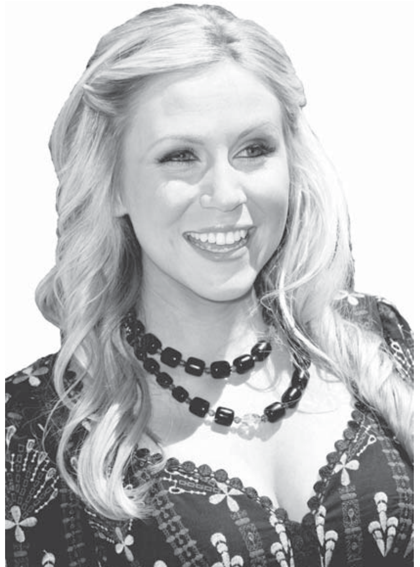
LOS ÁNGELES (EEUU). La actriz estadounidense, Ashley Eckstein, posa a su llegada al estreno de la película ‘Star Wars: The Clone Wars’ en Los Ángeles, California. El largometraje es la primera producción animada de Lucasfilm Animation.

director, éste nuevo filme ofrece la oportunidad de relatar una historia sobre la lucha que convirtió a la república en un imperio, y lo que llevó a una guerra civil que liberó a la galaxia. “Pasan muchas cosas: hay héroes, villanos, intrigas, aventuras. Todo es parte de la historia que conocemos, pero siempre había quedado en el ambiente algo de incertidumbre”, explicó. En 2005, la película “Star wars: Episodio III revenge of the sith”, cerró un ciclo de “Star wars”, pero George Lucas y los narradores de historias de Lucasfilm Animation consideraron que aún había mucho más para contar sobre “la muy lejana galaxia”.