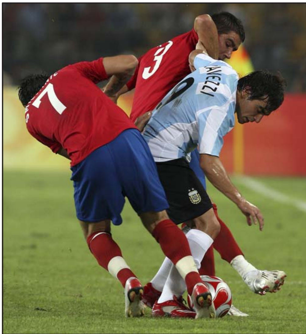
PEKÍN (CHINA). El argentino Ezequiel Lavezzi (centro) disputa el balón a los serbios Milan Smiljanic (izqda.) y Aleksander Kolarov durante el último partido de la ronda preliminar de fútbol de los Juegos Olímpicos de Pekín disputado en el Estadio de los Trabajadores, en Pekín.

Brasil no tuvo problemas para derrotar a la anfitriona con un brillante Thiago Neves autor de dos soberbios goles que lo confirman como