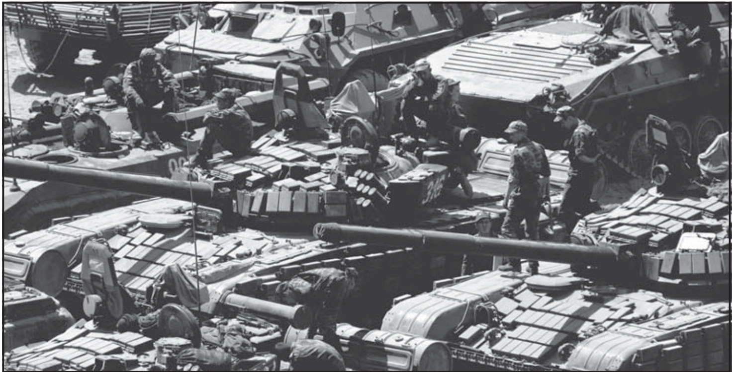
TSKHINVALI (GEORGIA). Tanques rusos hacen una breve parada mientras una parte de las tropas rusas marchan hacia Tskhinvali, capital del Osetia del Sur, Georgia. La guerra entre las fuerzas rusas y georgianas se ha intensificado y ambos bandos han llevado refuerzos a la región. Los peores enfrentamientos han tenido lugar en la ciudad de Tskhinvali, donde la lucha y los lanzamientos de misiles han continuado esporádicamente.

En una reunión con el presidente de Rusia, Dmitri Medvedev, Putin le expresó los horribles relatos que escuchó de los refugiados surosetas en su viaje a la república rusa de Osetia del Norte. Putin, quien hace casi diez años ordenó la entrada de las tropas rusas en Chechenia, dijo que lo que ha escuchado “excede el marco de operaciones militares” y es un “genocidio del pueblo oseta”. Medvédev dijo que ordenará a la Fiscalía documentar los “crímenes cometidos contra la población civil en Osetia del Sur”.