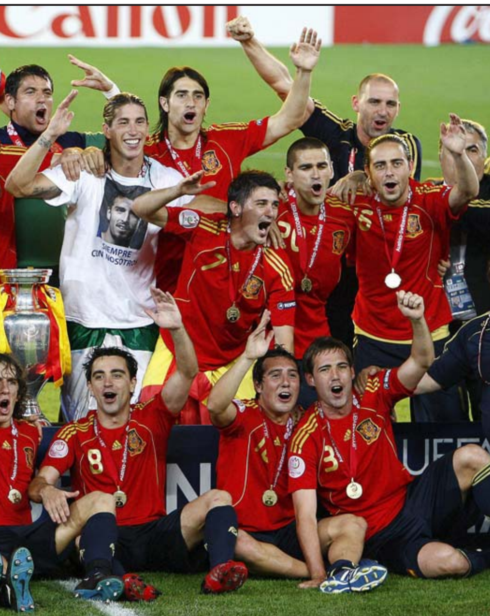
do final que les enfrentó en el estadio Ernst Happel de Viena.

Mertesacker aportaron tantos centímetros como poca cintura.