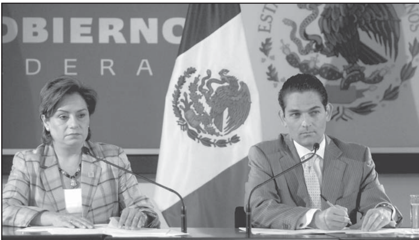
CIUDAD DE MÉXICO (MÉXICO). La secretaria de Relaciones Exteriores, Patricia Espinoza (izqda.), y el secretario de Gobernación, Juan Camilo Mouriño, participan de una rueda de prensa en las instalaciones de la Secretaría de la Gobernación, en donde se informó que el gobierno aceptó los términos en que fue aprobada en EEUU la Iniciativa Mérida, que canalizará 400 millones de dólares para combatir el crimen organizado en este país.

Mouriño expresó que los fondos aprobados, que no se reciben en efectivo sino en equipos y capacitación, demuestran la “confianza mutua” entre las dos naciones y el compromiso para “cooperar en términos de verdadera corresponsabilidad”, en la búsqueda de “la seguridad y el bienestar” de ambas sociedades. El apoyo estadounidense responde “a las necesidades específicas previamente identificadas por las instituciones mexicanas