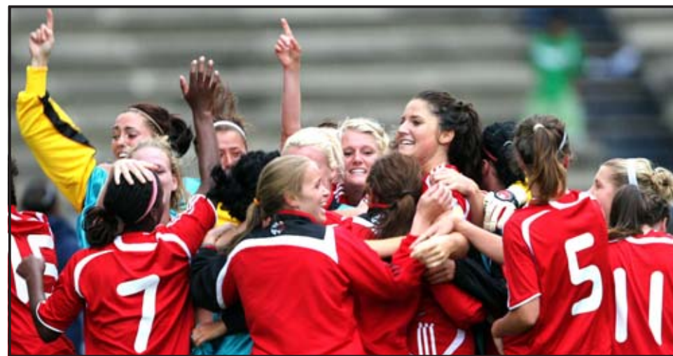
PUEBLA (MÉXICO). Jugadoras canadienses celebran su triunfo ante Estados Unidos en el partido por las eliminatorias de la Confederación Norte, Centroamericana y del Caribe de Fútbol (CONCACAF) para el mundial sub-20 femenino que les enfrentó en el estadio Cuahutemoc de Puebla.