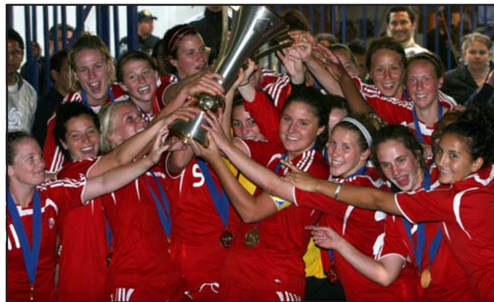
PUEBLA (MÉXICO). Jugadoras canadienses celebran tras obtener el título del torneo de las eliminatorias de la Confederación Norte, Centroamericana y del Caribe de Fútbol (CONCACAF) para el mundial sub-20 femenino después de derrotar a Estados Unidos en el estadio Cuahutemoc de Puebla.

Canadá y Estados Unidos aseguraron de esta forma su clasificación al Mundial femenino sub'20, en tanto que México se adjudicó la medalla de bronce y la tercera plaza al superar a Costa Rica por 3-2 en la tanda de penales. Las eliminatorias del Mundial femenino sub'20 en la zona de la CONCACAF convocaron a ocho selecciones en la ciudad mexicana de Puebla entre el 17 y el 28 de junio. El Mundial femenino sub'20 se disputará del 19 de noviembre al 7 de diciembre en Chile.