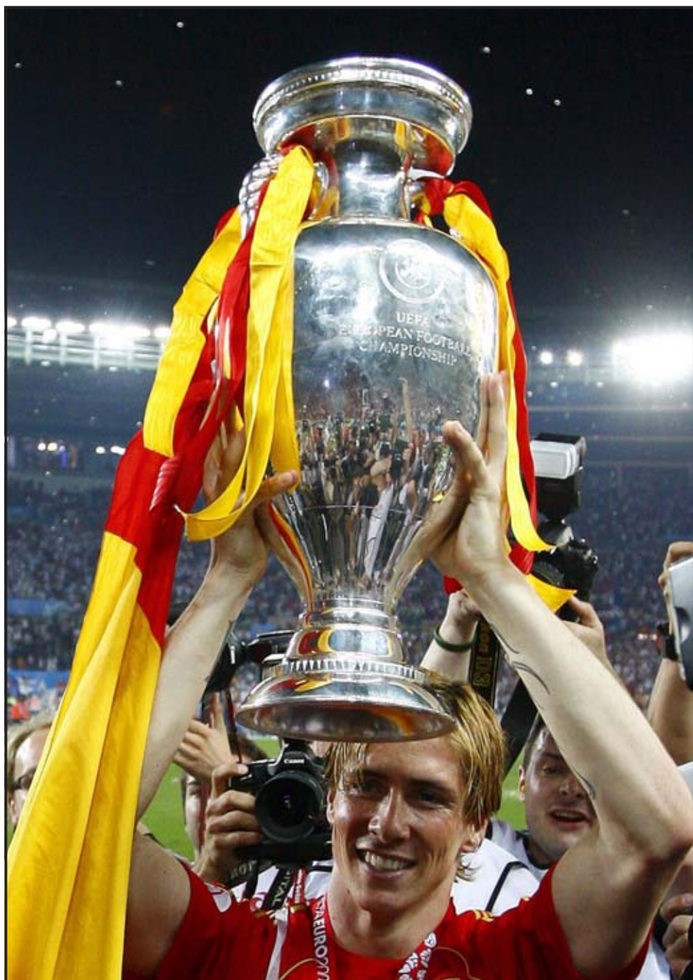
VIENA (AUSTRIA). El delantero español Fernando Torres sostiene el trofeo de campeones de la Eurocopa 2008, tras ganar a Alemania por 1-0, en el partido final que les enfrentó en el estadio Ernst Happel de Viena.

La selección de España, dirigida por Luis Aragonés, hizo realidad el sueño de varias generaciones, derrotó a Alemania en la final con un gol de Fernando Torres y se proclamó campeón de Europa, para acabar con 44 años de frustraciones e instalar al fútbol español en la cumbre.