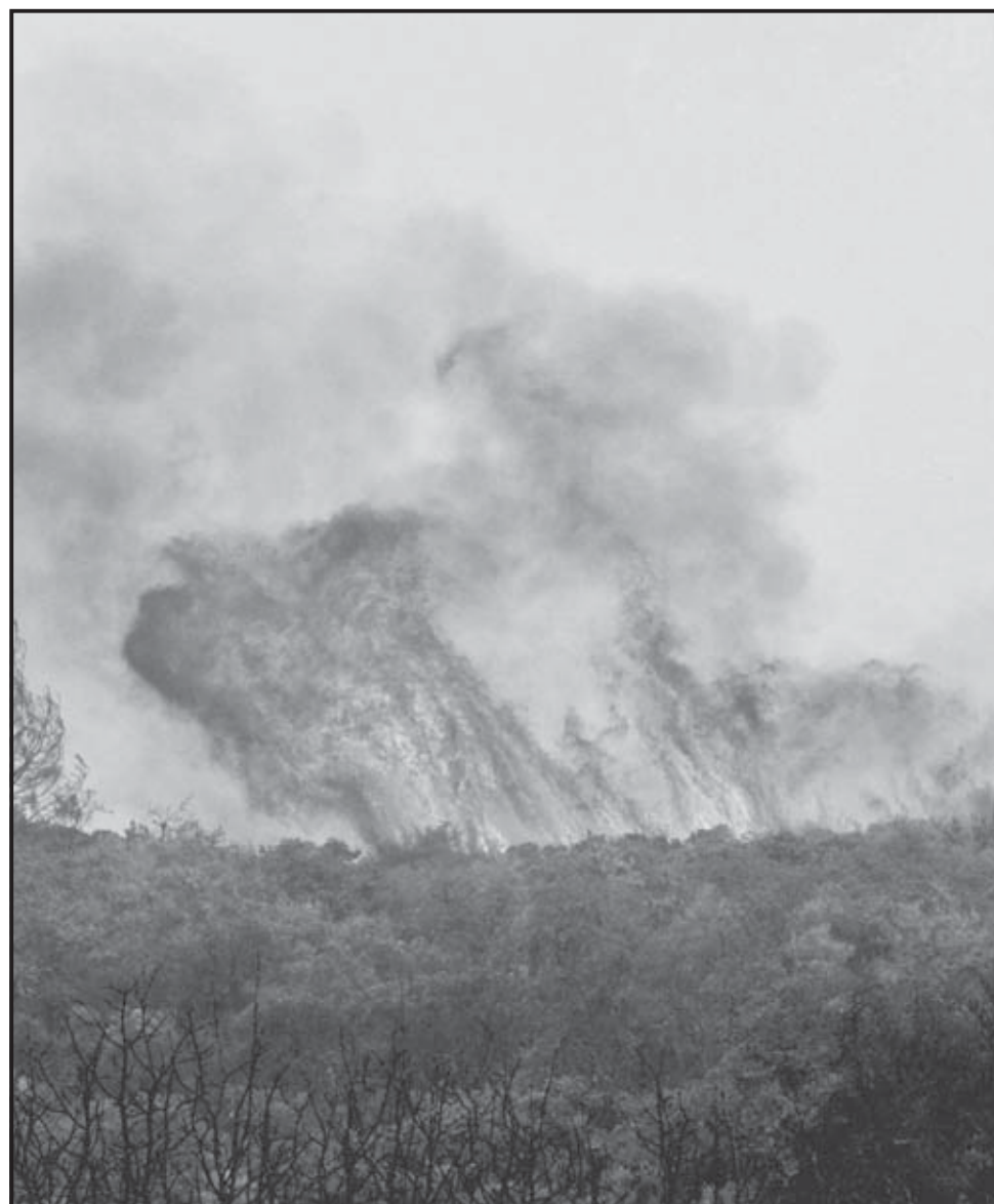
LAKE COUNTY (EEUU). Vista de las llamas en Walker Ridge, cerca de Lake County, a las afueras de Clear Lake, California, donde el incendio ha consumido más de cinco mil hectáreas.

a cancelar numerosas actividades públicas y eventos deportivos en diversas regiones. En algunas zonas las autoridades pidieron a los ciudadanos que en la medida de lo posible no salgan al exterior y reduzcan sus actividades debido a la contaminación del aire. ●