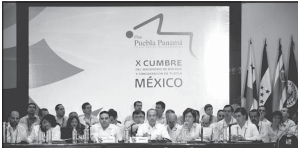
VILLAHERMOSA (MÉXICO). Vista general de la sesión de trabajo de los jefes de Estado y de gobierno de México, Colombia y Centroamérica, que participan en la X Cumbre del Mecanismo de Diálogo y Concertación de Tuxtla, que se lleva a cabo en Villahermosa, capital del estado de Tabasco.

El presidente mexicano enfatizó que la región debe unir esfuerzos para combatir al crimen