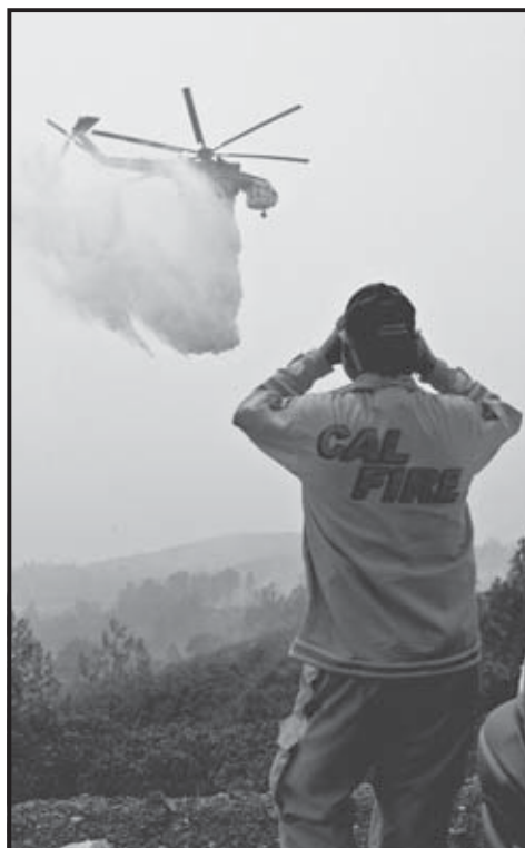
LAKE COUNTY (EEUU). Un helicóptero de la Guardia Nacional lanza agua para controlar las llamas en Lake County, a las afueras de Clear Lake, California, donde el incendio ha consumido más de cinco mil hectáreas.

Los incendios obligaron a cortar parte de la autopista panorámica de California, que bordea la costa y es una importante atracción turística, en las cercanías del parque nacional de Los Padres, donde han