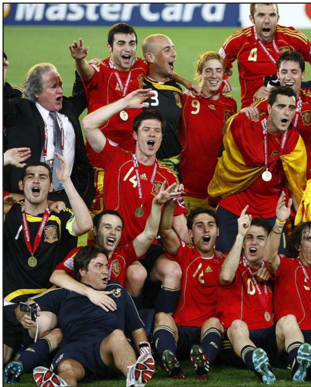
VIENA (AUSTRIA). Los jugadores españoles celebran con el trofeo de campeones de la Eurocopa 2008 tras ganar 1-0 a Alemania en el partido final.