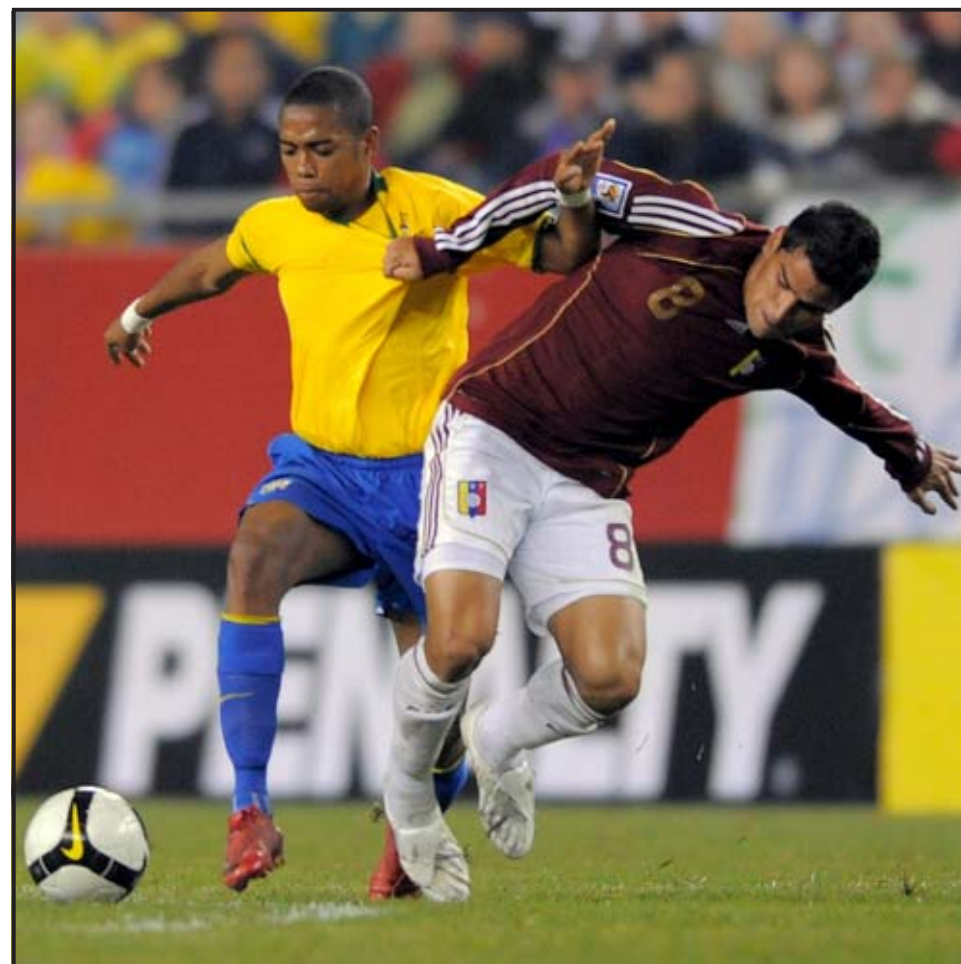
FOXBOROUGH (EEUU). El jugador de la selección de Brasil, Robinho (izqda.), disputa el balón con Tomás Rincón (dcha.), de Venezuela, durante el partido amistoso en el estadio Gillette de Foxborough, Massachusetts.

Porteros: Diego Alves (Almería, ESP), Renan (Internacional). Defensas: Alex Silva (São Paulo), Breno (Bayern de Múnich, GER), Thiago Silva (Fluminense), Filipe (Deportivo La Coruña, ESP), Leo (Gremio), Leonardo (Olympiakos, GRE), Nei (Atlético Paranaense), Rafinha (Schalke 04, GER). Centrocampistas: Anderson (Manchester United, ING), Charles (Cruzeiro), Diego (Werder Bremen, GER), Hernanes (São Paulo), Lucas (Liverpool, ING), Ramires (Cruzeiro), Thiago Neves (Fluminense), Fernandinho, (Shakhtar Donetsk, UCR). Delanteros: Alexandre Pato (Milán, ITA), Rafael Sobis (Real Betis, ESP), Robinho (Real Madrid, ESP), Pedro Oldoni (Atlético Paranaense).