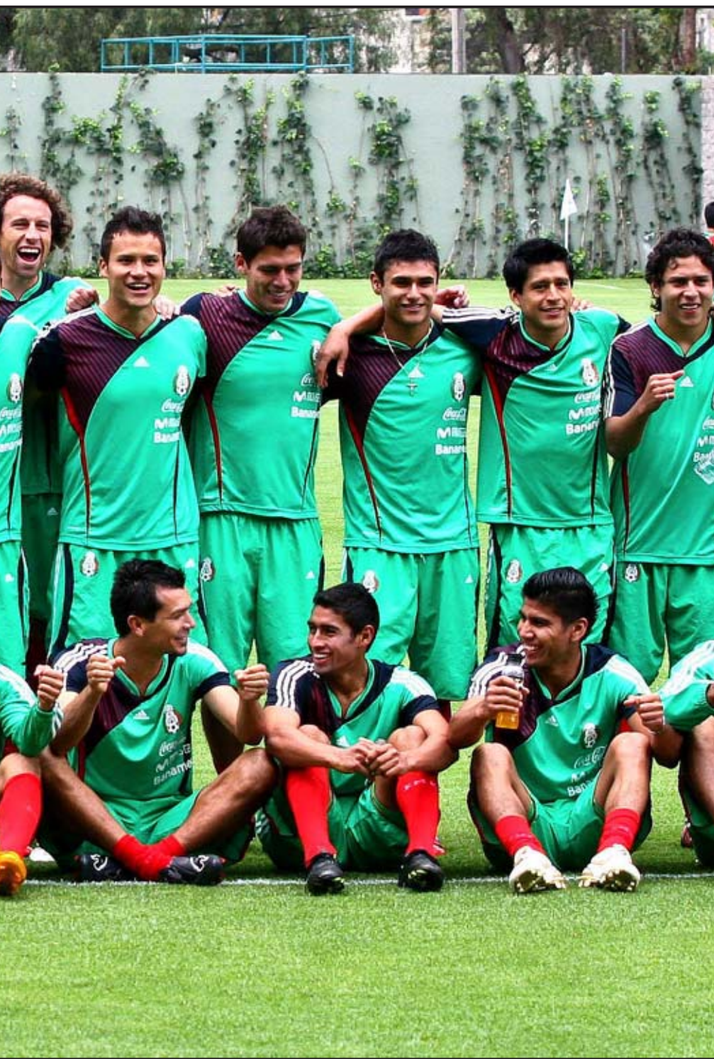
o Rendimiento de Ciudad de México previo a su encuentro oficial clasificatorio para el mundial de Sudáfrica 2010 ante Belice.

repesca con el quinto de las eliminatorias sudamericanas. Eriksson, de 60 años y ex seleccionador de Inglaterra, fue contratado para un periodo que incluirá las eliminatorias de la CONCACAF y concluirá en la cita de Sudáfrica 2010, en la que el estratega buscará llegar, por lo menos, hasta los cuartos de final. Sucesor del mexicano Hugo Sánchez en la dirección del Tri, Eriksson asumirá plenamente sus funciones el próximo mes, aunque estará pendiente del actual