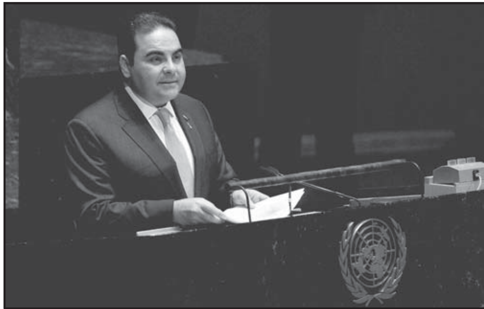
NUEVA YORK (EEUU). El presidente de El Salvador, Elías Antonio Saca, habla sobre el SIDA en la sede de las Naciones Unidas en Nueva York.

El secretario de Salud mexicano destacó que los dos millones de personas con VIH en