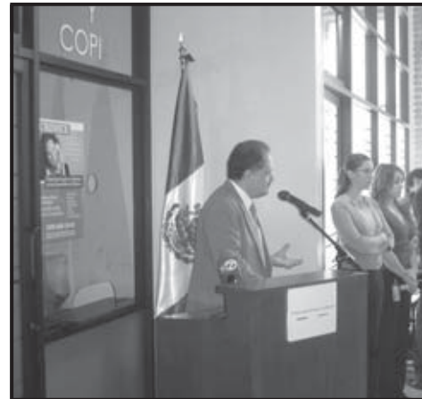
SAN FRANCISCO (CALIFORNIA). Discurso del Cónsul General de México en San Francisco, Carlos Félix, durante la inauguración de la "Ventanilla de Salud".