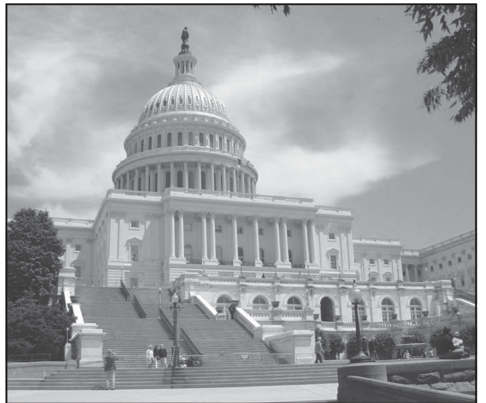
Vista del edificio del Congreso. Foto de archivo

Se percibe una clara frustración de los demócratas frente al continuo aumento del precio de la gasolina, que ya superó los cuatro dólares por galón -precio promedio en el país- y que, según dijo la senadora Claire McCaskill, “es el mayor problema que afrontan los estadounidenses”. Los