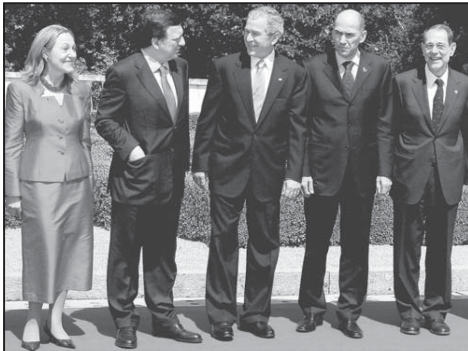
BRDO (ESLOVENIA). La comisaria de Exteriores de la Unión Europea, Benita Ferrero-Waldner; el presidente de la Comisión Europea, José Manuel Durao Barroso; el presidente de Estados Unidos George W. Bush; el primer ministro de Eslovenia y presidente de turno del Consejo de la UE, Janez Jansa, y el Alto Representante de Política Exterior, Javier Solana, posan en el castillo de Brdo, Eslovenia, durante la cumbre que se celebró entre la UE y EEUU.

El comunicado conjunto de la cumbre expresa la voluntad de colaborar para garantizar que los bancos iraníes “no puedan abusar del sistema