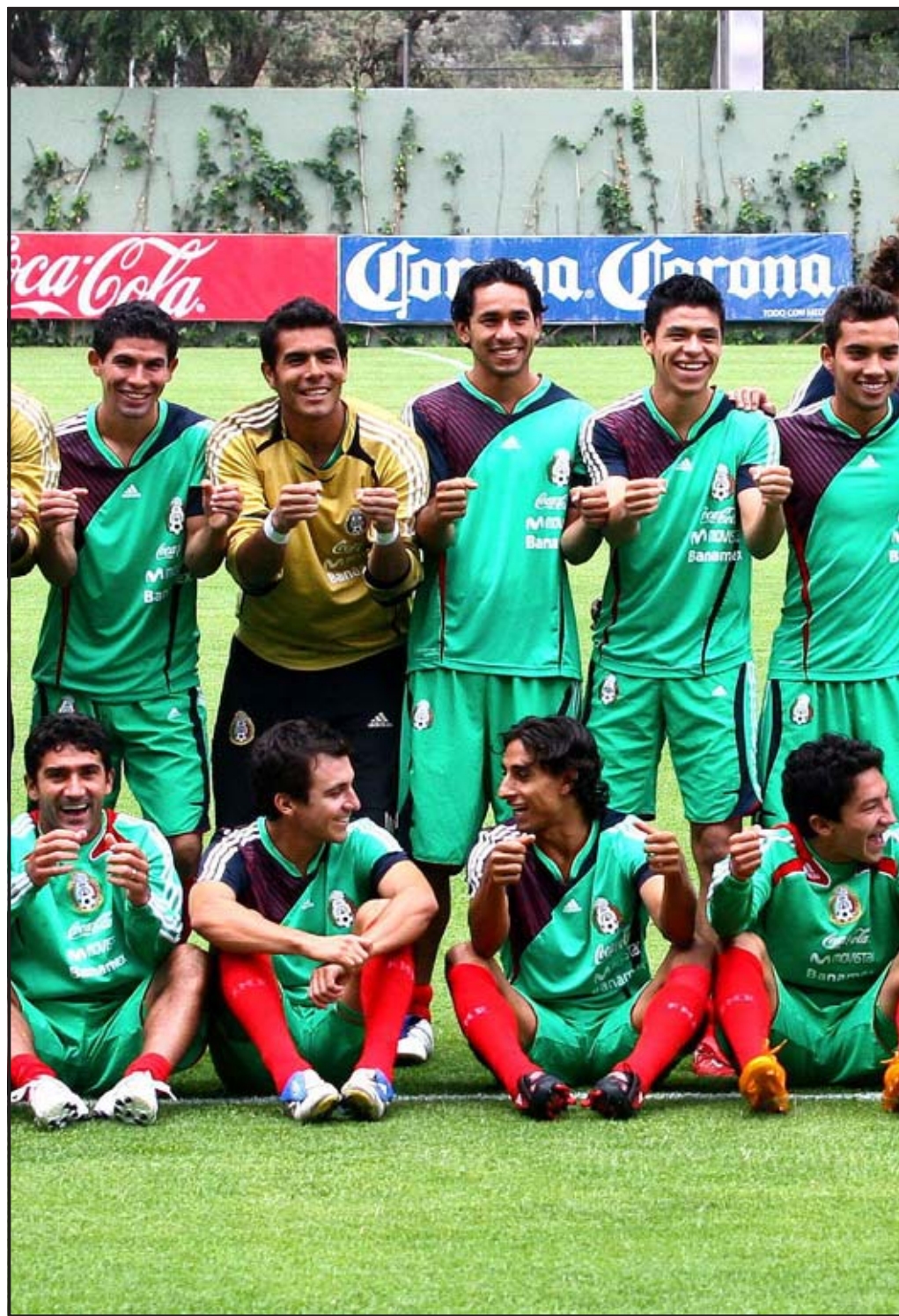
CIUDAD DE MÉXICO (MÉXICO). Los jugadores de la selección mexicana de fútbol posan tras el entrenamiento de la tricolor en el Centro de Alto Rendimiento de la Federación Mexicana de Fútbol Profesional.

toque, otra cara, otra visión al tema del director técnico de la selección”.