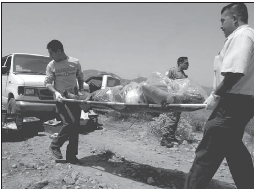
TIJUANA (MEXICO). Especialistas forenses recogen un cuerpo, parte de los ocho crímenes violentos registrados en Tijuana y Rosarito en el estado de Baja California, según confirmaron autoridades policiales y del estado. En siete de esos casos, las víctimas fallecieron por impactos de arma de fuego, en tanto que la última, por arma punzo-cortante.

El fiscal explicó que la reacción violenta de los narcotraficantes se debe a que “buscan