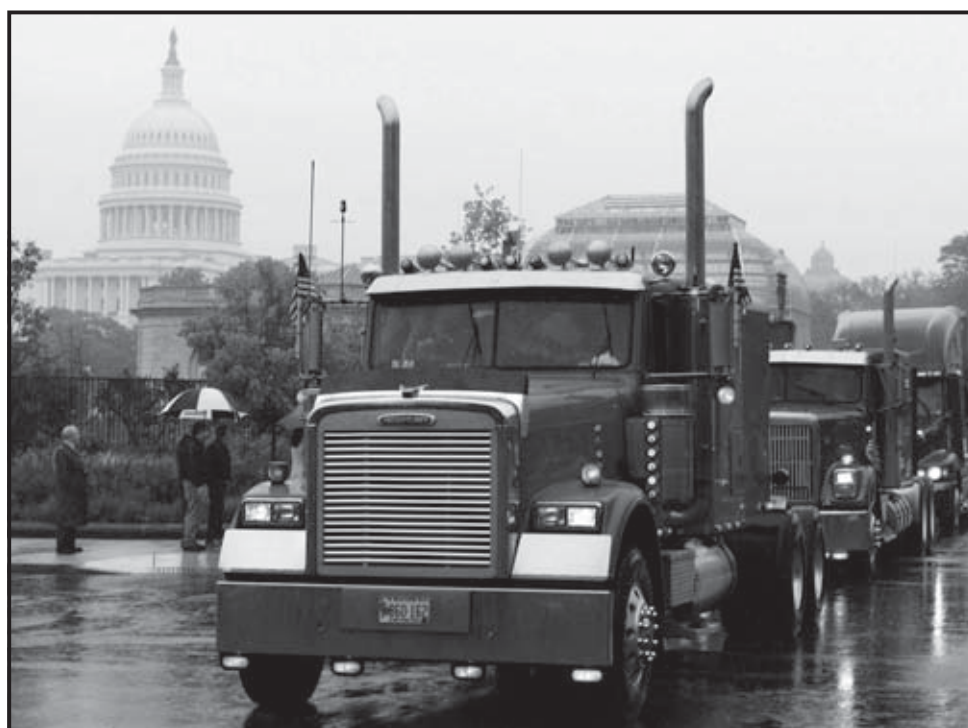
WASHINGTON (ESTADOS UNIDOS). Camiones circulan cerca del Capitolio durante una manifestación de camioneros para protestar por los altos precios del combustible.

Lautenberg insistió en que los demócratas están intentando cambiar las políticas energéticas, pero afrontan resistencia de los republicanos y los petroleros para concretar sus planes. Explicó que bajo el actual Congreso de mayoría demócrata se aprobó una nueva ley energética que permitirá, entre otras cosas, mejorar la eficiencia energética de los automóviles, así como invertir más en energías renovables. El senador destacó que a largo plazo es necesario atajar la especulación en el mercado a la que culpó de los actuales precios récord de los combustibles. Insistió