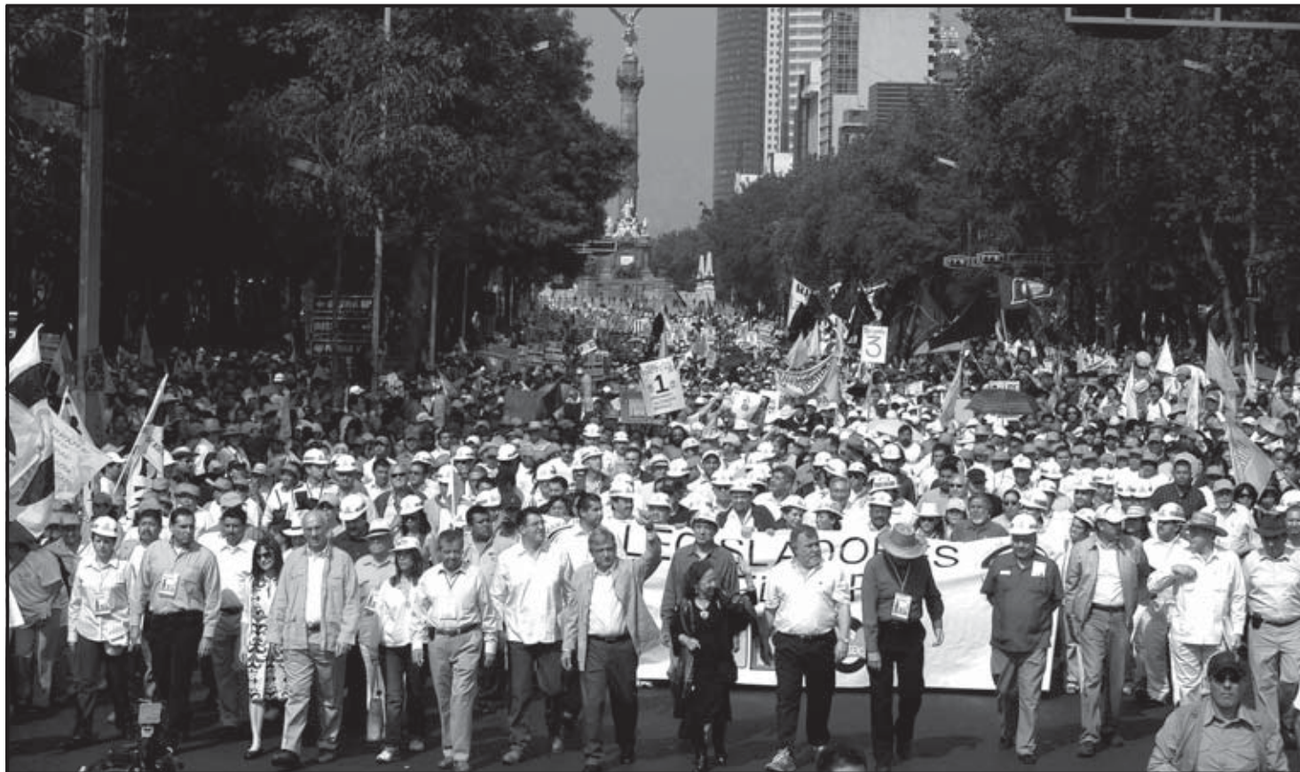
CIUDAD DE MÉXICO (MÉXICO). El líder izquierdista, Andrés Manuel López Obrador (centro), saluda durante un encuentro donde anunció que iniciará una gira nacional para oponerse a la reforma energética promovida por el presidente Felipe Calderón y fortalecer su movimiento de resistencia civil pacífica.

La jornada comenzó con una concentración del Movimiento Nacional por la Defensa del Petróleo, organismo creado por López Obrador, en el Ángel de la Independencia, lo que derivó en una marcha que durante hora y media recorrió el centro de la capital mexicana. Antes del mitin, se escucharon música y corridos revolucionarios en la principal plaza pública de México, donde el gobierno capitalino del izquierdista Marcelo Ebrard no programó actividades oficiales. Miles de hombres y sobre todo mujeres, entre las que destacaban por su activismo las llamadas “Las Adelitas”, recorrieron el centro de la ciudad portando camisetas