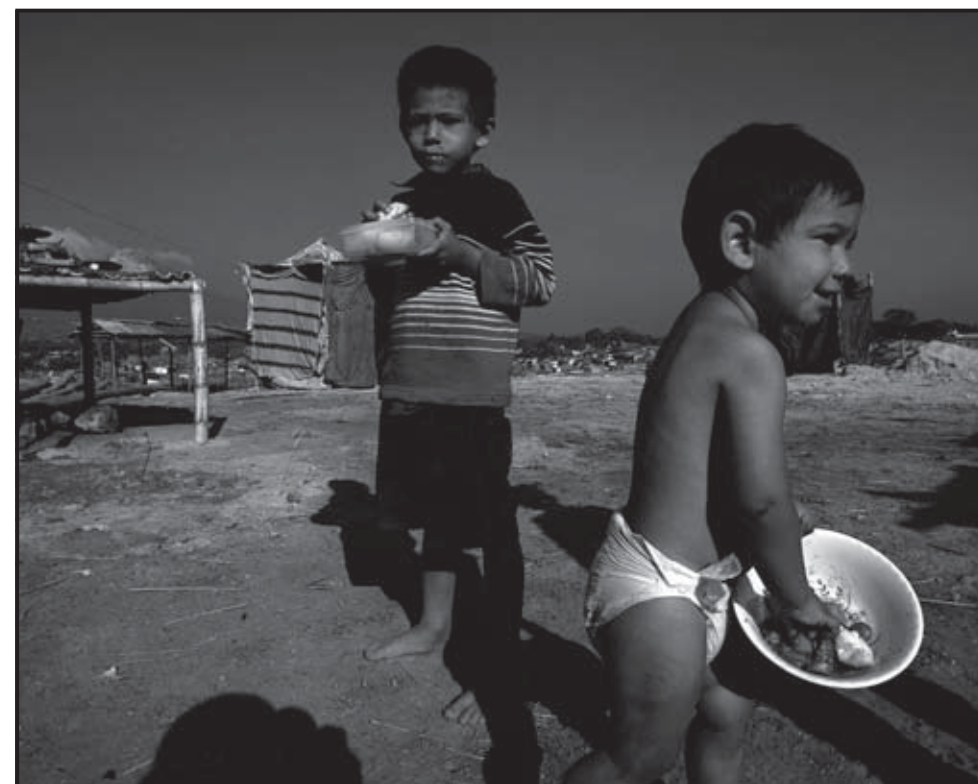
SAN SALVADOR (EL SALVADOR). Dos niños salvadoreños comen sus alimentos en un comunidad en San Salvador, donde se reunieron los cancilleres y ministros de agricultura de Centroamérica para tratar el tema de la seguridad alimentaria regional.

A su vez, se convocó a una reunión de los Consejos de Ministros de Agricultura, Ambiente y Salud para discutir, en una fecha por