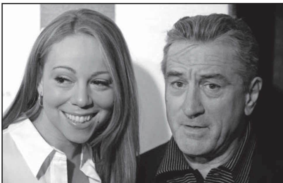
NUEVA YORK (EE.UU.). La cantante y actriz estadounidense, Mariah Carey (izqda.), y el actor estadounidense y fundador del Festival de Tribeca, Robert DeNiro (dcha.), asisten al estreno de la película "Tennessee" durante el Festival de Cine de Tribeca.