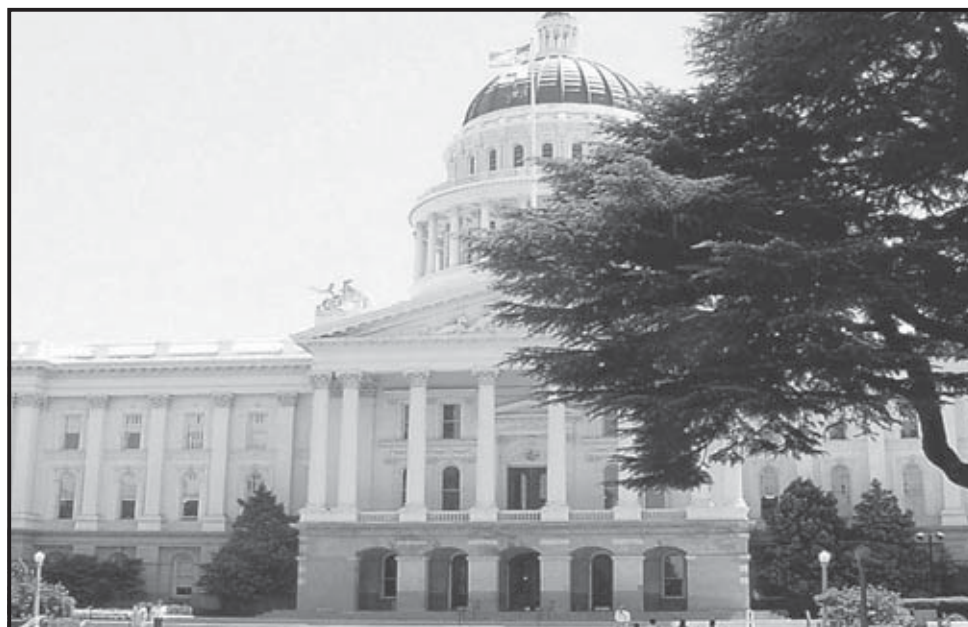
SACRAMENTO (ESTADOS UNIDOS). Edificio del Capitolio, sede de la legislatura del Estado de California.

preocupación ante el tema, en momentos que la crisis económica que afecta a la nación golpea al estado, y la suba de la gasolina y los precios de los alimentos genera más inflación. ●