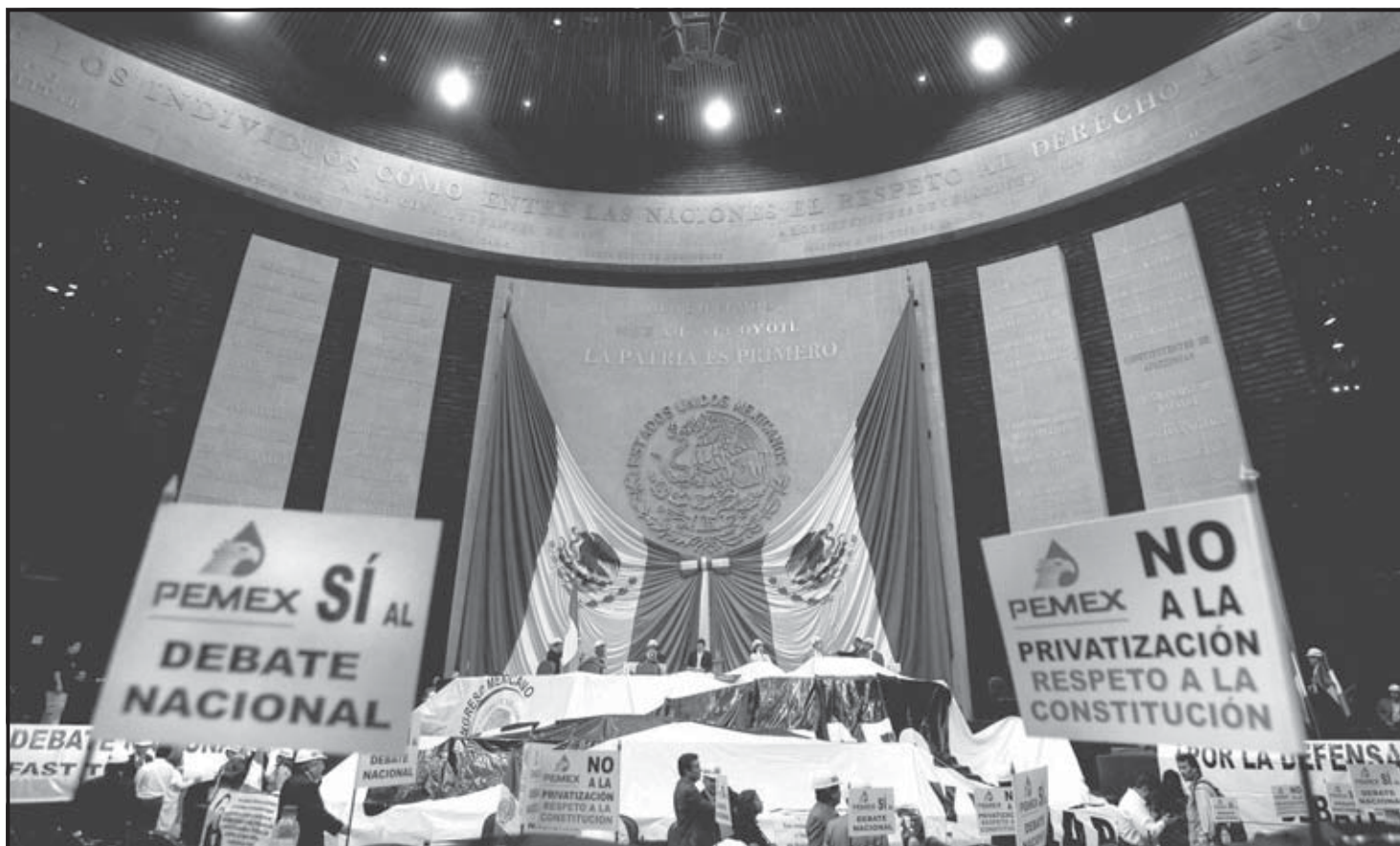
CIUDAD DE MÉXICO (MÉXICO). Aspecto de la Cámara de Diputados en donde la oposición de izquierda ocupa las tribunas para impedir la discusión parlamentaria de la reforma energética propuesta por el Ejecutivo y exigir la apertura de un debate nacional sobre el tema.

En particular y con énfasis, atacó el plan del presidente Calderón de permitir mayor participación de la iniciativa privada en