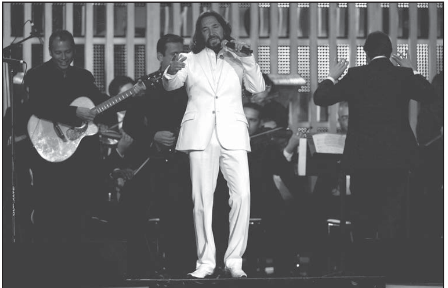
HOLLYWOOD (FLORIDA). El cantante mexicano, Marco Antonio Solís, durante su presentación en la gala de entrega de los Premios Billboard de la Música Latina 2008 que se llevó a cabo en el Hotel Seminole Hard Rock Hollywood, en Hollywood, Florida.

Tras una actuación del cantante español Enrique Iglesias, el reguetonero Daddy Yankee le entregó a Kanny García su primer premio. Iglesias, por su parte, recibió el premio "Reconocimiento especial", por ser el artista con el mayor número de éxitos (18) colocados en la revista Billboard.