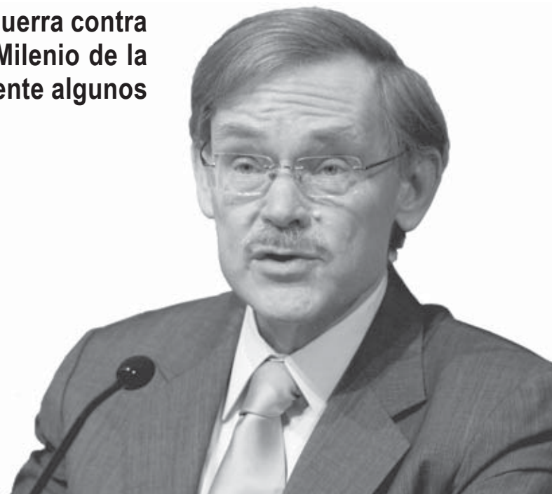
WASHINGTON (EE.UU.). El presidente del Banco Mundial (BM), Robert Zoellick, muestra un saco de arroz en una rueda de prensa previa a la Asamblea de Primavera del Fondo Monetario Internacional en Washington. Zoellick pidió una acción internacional inmediata para hacer frente a la situación de emergencia en países en desarrollo como Haití, a raíz de la subida de los precios de los alimentos.