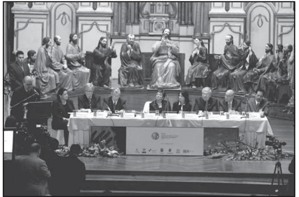
CUENCA (ECUADOR). La ministra de Relaciones Exteriores de Ecuador, María Isabel Salvador (centro), y el secretario general Iberoamericano, Enrique Iglesias (izqda.), participan en Cuenca de la inauguración del I Foro Iberoamericano sobre Migración y Desarrollo, donde el presidente en funciones del gobierno español, José Luis Rodríguez Zapatero, a través de un video proyectado, defendió una emigración "ordenada y digna", en la que se respeten los derechos de los afectados, que recordó que son "seres humanos".

El secretario general Iberoamericano, Enrique Iglesias, señaló en la inauguración del foro que las migraciones "son una parte esencial de nuestra identidad" iberoamericana, y propugnó el "diálogo para buscar la cooperación y el consenso" con el fin de "humanizar" éste fenómeno que afecta a millones de personas. Iglesias dijo que hay que llevar a cabo "aproximaciones políticas, económicas, sociales y éticas" para cumplir el Compromiso de Montevideo, aprobado por la Cumbre Iberoamericana de 2006, que establece la garantía y respeto a "los derechos humanos y la diversidad cultural de los migrantes y sus familias". También remarcó la firma de un