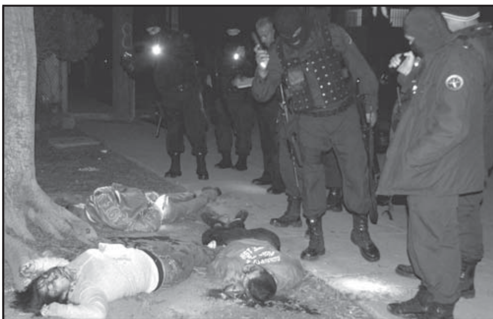
TIJUANA (MÉXICO). La reforma intenta dar más herramientas al sistema judicial ante la creciente violencia del crimen organizado. En la foto, oficiales de la policía inspeccionan los cadáveres de tres de las cuatro personas acribilladas, entre ellas una mujer, que fueron encontrados en dos lugares distintos en la ciudad mexicana de Tijuana.

La reforma lleva varios meses de debate legislativo, pues en diciembre pasado había sido votada por senadores y debió pasar a