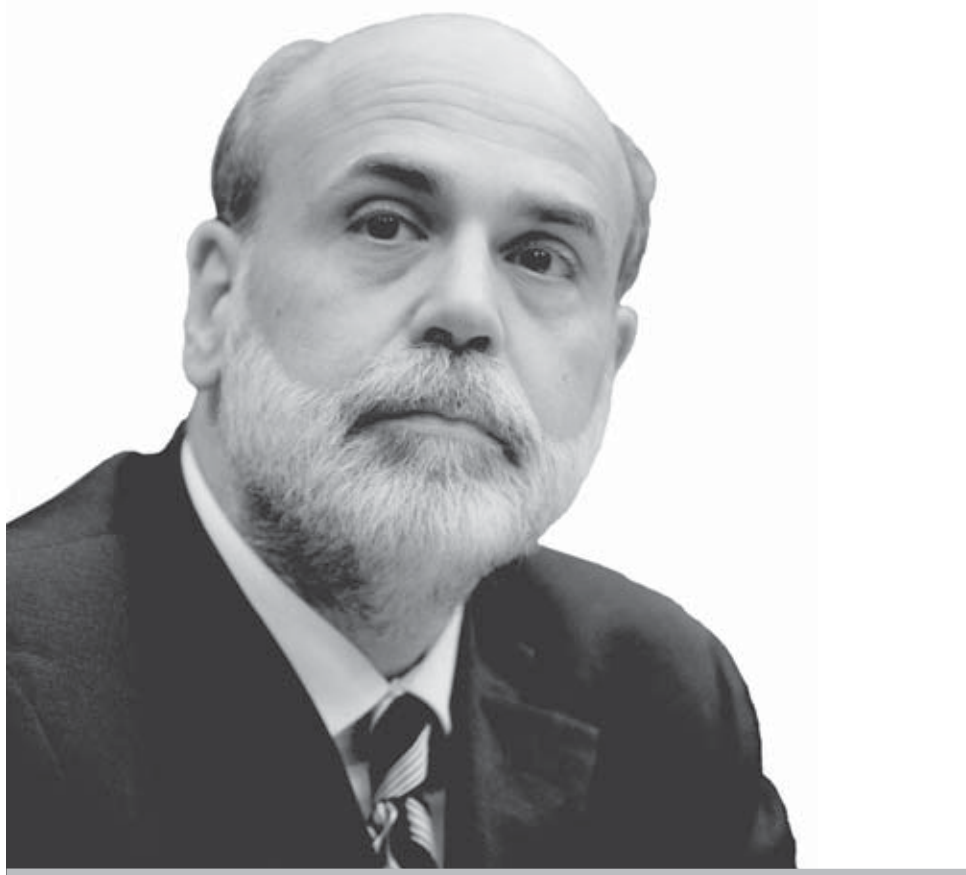
WASHINGTON (EE.UU.). El presidente de la Reserva Federal estadounidense, Ben Bernanke, comparece ante el Congreso en el Capitolio en Washington DC. Bernanke reiteró que existen riesgos en la economía estadounidense y también reconoció que la inflación es otro peligro.

Los precios de la vivienda cayeron en el 2007 por primera vez desde la Gran Depresión de 1929 y la contracción se agudizó en enero del 2008, el último mes del que se tienen datos. Los problemas de ese mercado se han contagiado a los bancos que extendieron hipotecas de forma eufórica en los años del "boom" inmobiliario y luego las vendieron como títulos en las bolsas. El salto de la morosidad y remates ha llevado a una restricción del crédito en Estados Unidos. "Sufrimos un trastorno sostenido del proceso de crédito, que lleva sucediendo desde el pasado agosto y aún no