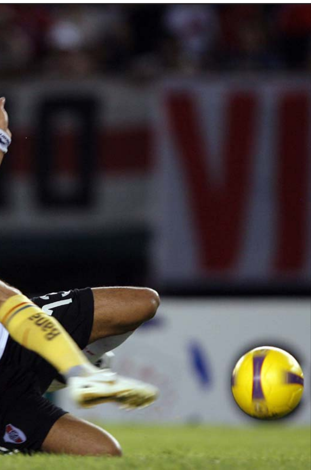
de River Plate, durante el partido por la Copa Libertadores de América que les enfrentó en el estadio de Monumental de Buenos Aires.

provocó una pelea, se desconcentró y se llevó la derrota.