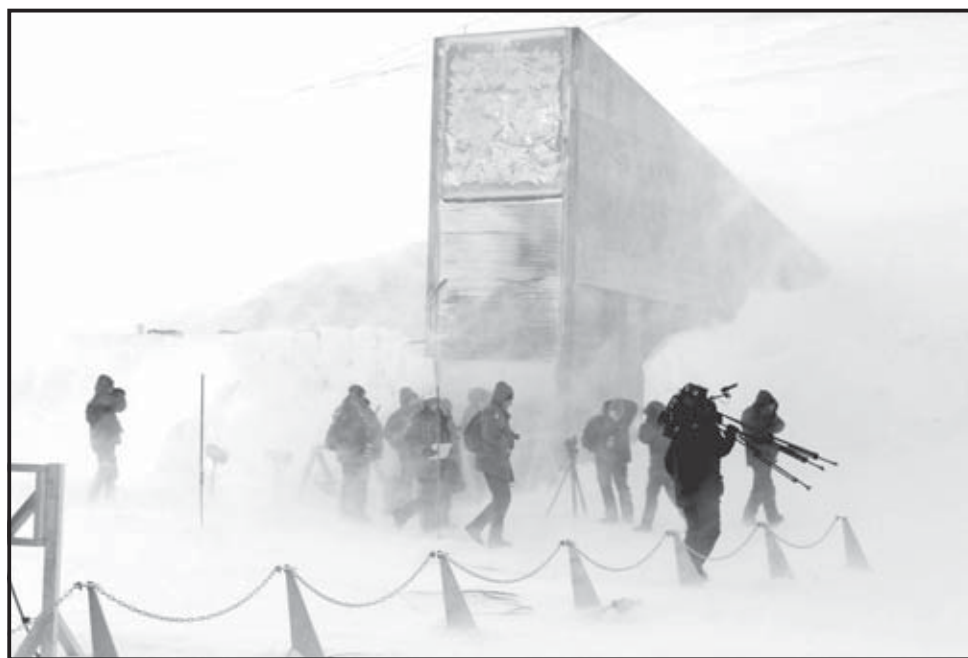
LONGYEARBYEN (NORUEGA). Los periodistas abandonan la isla de Longyearbyen tras la inauguración de la Bóveda Global de Semillas de Svalbard. La bóveda fue inaugurada tras una ceremonia en la que se depositaron 100 millones de simientes procedentes de todo el mundo. Su finalidad es conservar las semillas y la tradición agrícola en un caso de desastre natural.

La bóveda acogerá semillas de cerca de noventa cultivos como la alfalfa, espárrago, judía, cebada, albahaca, acelga, zanahoria, lenteja, tomate, cebolla, patata, guisante, espinaca, trigo y arroz. Se trata de variedades poco frecuentes o tipos tradicionales producidos en países en desarrollo, excluyendo árboles frutales y plantas medicinales, así como organismos genéticamente modificados.