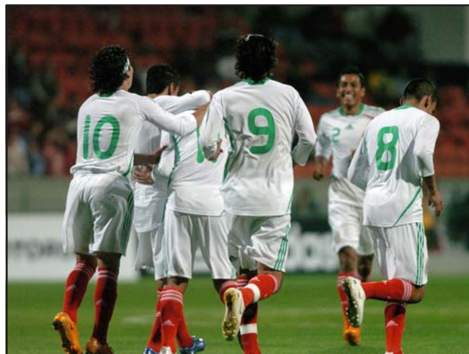
TIJUANA (MÉXICO). Los jugadores de la selección mexicana sub 23 durante el partido amistoso que jugaron en la ciudad de Tijuana, con miras a los Juegos Olímpicos de Pekín.