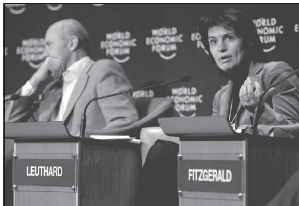
DAVOS (SUIZA). La ministra de Finanzas de Suiza, Doris Leuthard (dcha.), y el director general de la OMC, Pascal Lamy (izqda.), participan en una mesa redonda en el marco de la reunión anual del Foro Económico Mundial de Davos.

La reunión ministerial aun debe ser confirmada, y por lo tanto, la decisión tiene que ser refrendada por los 151 países que forman la Organización Mundial del Comercio (OMC). La reunión ministerial de abril sería aproximadamente dos meses después de que se hayan presentado los nuevos documento-borrador tanto en el área agrícola como en el sector de infraestructuras. El principal condicionamiento a la reunión es que los dos textos tengan “un equilibrio”, para poder contentar tanto a los países desarrollados como a los emergentes, algo en lo que puso especial