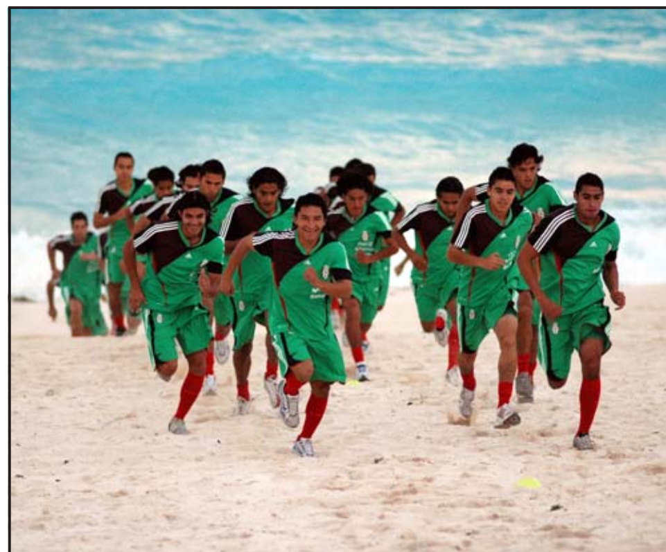
CANCÚN (MÉXICO). Los convocados a la selección mexicana de fútbol realizan sus entrenamientos a nivel del mar en el centro de recreo de Cancún, estado de Quintana Roo, sureste de México.

Antes del Preolímpico, el seleccionado tendrá cinco partidos amistosos; contra Chile, en Toluca el 19 de febrero; frente a Ecuador, en Querétaro el 22 de febrero; ante Paraguay, en Tijuana el 27 de febrero; contra Australia, en Oakland, el 2 de marzo, y finalmente con Finlandia, en Dallas, el 6 de marzo.