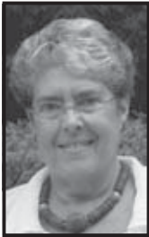
Por Bessy Reyna

La elocuente columnista nos introduce en el valor del voto para definir el destino de un país, de las familias, y por consiguiente, para definir parte del destino de cada ciudadano.