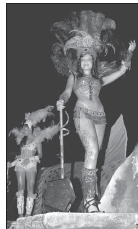
Carnaval de Río de Janeiro en Brasil.

que en el 2008 cumpliría 100 años. Cada escuela debe desfilan con un mínimo de 2.500 y un máximo de 4.500 componentes, y un límite de entre seis y ocho carros alegóricos. La escuela de São Clemente es la que da inicio a los desfiles del Grupo Especial. Le siguen Porto da Pedra, Salgueiro, Portela, Mangueira y Viradouro, y luego, Mocidade, Unidos da Tijuca, Imperatriz Leopoldinense, Vila Isabel, Grande Rio y Beija-Flor. En los dos últimos años, se ha reducido el número de escuelas del Grupo Especial, que ha pasado de catorce a doce. La última clasificada éste año bajará a un grupo inferior, el llamado Grupo de Acceso, y la primera clasificada de éste último, se sumará a las mejores en el 2009. Los colores, brillos, ritmos, desenfrenos, recorren las calles y el Sambódromo de Río de Janeiro en Brasil. Una fiesta a la que llaman el Carnaval más grande del mundo. ●