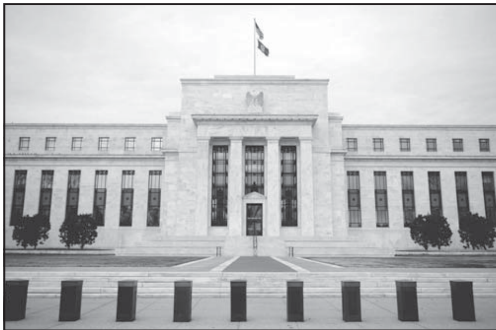
WASHINGTON (EE.UU.). Imagen de la sede de la Reserva Federal estadounidense (Fed) en Washington DC. La Fed recortó los tipos de interés en un 0,50 por ciento, lo que sitúa la tasa actual en el 3 por ciento, en un intento por estimular la economía estadounidense.

En un comunicado donde se explicó la decisión, el presidente de la Reserva Federal, Ben Bernanke y sus colegas señalaron que "los mercados financieros continúan sometidos a una considerable tensión". La acción fue aprobada por 9 votos a favor y uno en contra. Richard Fisher,