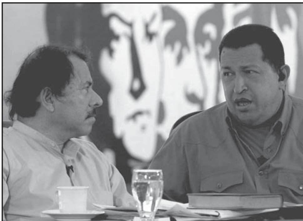
CAICARA DE MATURÍN (VENEZUELA). El presidente de Venezuela, Hugo Chávez (dcha.), habla con su homólogo nicaragüense, Daniel Ortega (izqda.), durante la transmisión de su programa 'Aló presidente'. Ortega estaba en Venezuela en una visita que incluyó la VI Cumbre de la Alternativa Bolivariana para las Américas (ALBA) que se realizó ayer.

La iniciativa respondió al análisis que ambos presidentes hicieron de la situación latinoamericana, en la que destacaron que Estados Unidos, a través de Colombia, está amenazando “no solo a Venezuela, sino a toda América Latina”, en palabras de Ortega. “Si se meten con alguno de nosotros se estarán metiendo con todos. Tocar a Venezuela es