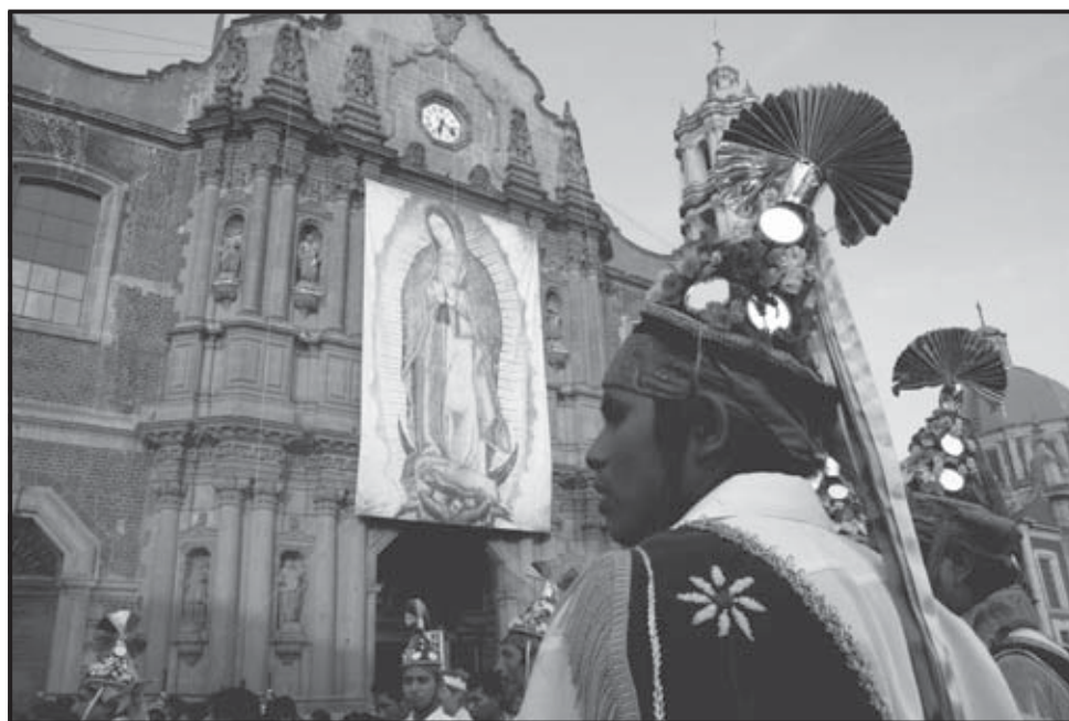
CIUDAD DE MEXICO (MÉXICO). Creyentes católicos de la Virgen de Guadalupe aguardan en carpas frente a la Basílica de Guadalupe en Ciudad de México, a donde llegaron al igual que millones de devotos provenientes de todas partes del país y del extranjero.

Según la tradición, la Guadalupana se apareció al indígena Juan Diego, en el cerro del Tepeyac, donde ahora se asienta la Basílica. La leyenda cuenta que la imagen de la Virgen quedó impresa en la tilma (poncho) de Juan Diego, y desde 1531 comenzaron las peregrinaciones al lugar para ver la prenda del indígena. En el 2006, más de 18 millones de peregrinos visitaron la Basílica, y solo en la primera quincena de diciembre ocho millones. Entre el día 11 y el 12, tres millones de personas se acercan a honrar a la Virgen y esperan ser bendecidos. Durante esos días se celebran 37 misas diarias en la Basílica, se realizan confesiones durante las 24 horas del día, y unas 7.000 personas trabajan para atender al peregrino. ●