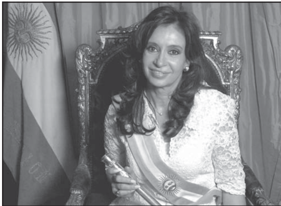
BUENOS AIRES (ARGENTINA). La presidenta de Argentina, Cristina Fernández de Kirchner, posa para la foto oficial con el bastón y la banda presidencial, en el sillón presidencial de la Casa Rosada.

Su discurso, de unos 45 minutos, tuvo el momento de mayor tensión cuando, después de agradecer la presencia del presidente uruguayo, Tabaré Vázquez, culpó a Uruguay por el origen del conflicto debido a la instalación en ese país de una papelería de la finlandesa Botnia a orillas del fronterizo río Uruguay. “Quiero decirle que no tendrá en mí ni un solo gesto que profundice nuestras diferencias”, destacó Fernández dirigiendo su mirada al sitio en que se encontraba Vázquez. “Pero también que esta situación que hoy atravesamos no es imputable a Argentina, porque lo cierto es que nos hemos presentado ante la Corte de