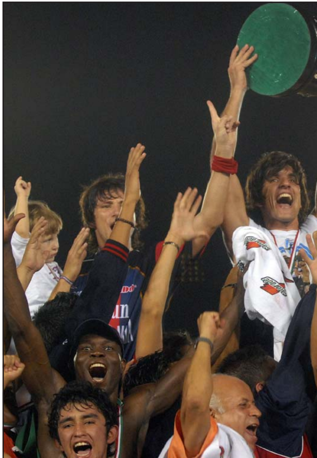
CANCÚN (MÉXICO). Jugadores del Atlante festejan con la copa de campeón el título de campeones, conseguido tras el triunfo 2-1 de su equipo del Estadio Andrés Quintana Roo en Cancún. Ahora todos apuntan al Clausura 2008.

Arsenal de Argentina, el equipo campeón de la Copa Sudamericana 2007, y Graf llegará a proceder del fútbol de Turquía.