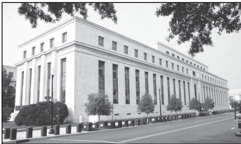
WASHINGTON (EE.UU.). Edificio de la Reserva Federal estadounidense (Fed) en Washington DC. La Fed bajó en 0,25 puntos porcentuales la tasa de interés interbancario, que ahora queda en el 4,25 por ciento.