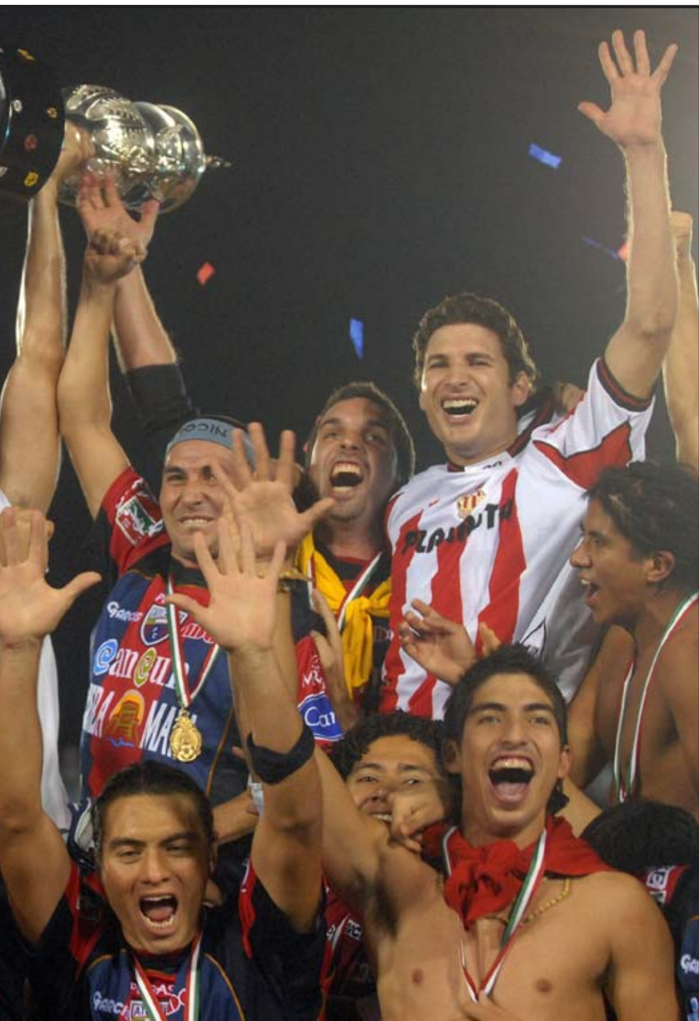
Los Pumas de la UNAM, durante el partido correspondiente a la final del Torneo Apertura 2007 del fútbol mexicano, celebrado en la cancha