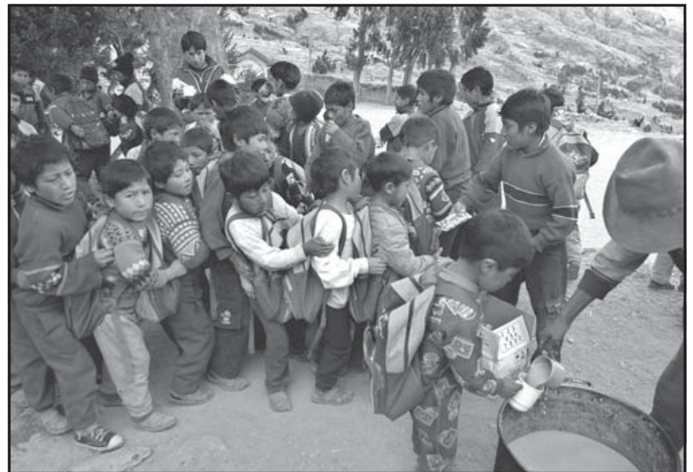
CUZCO (PERÚ). Foto de archivo de niños de la comunidad andina de Callatiac, en el departamento de Cuzco, tomando su refrigerio durante un recreo de sus clases. Alrededor de 750.000 niños padecen desnutrición crónica en Perú, uno de cada cuatro menores de cinco años está desnutrido y no alcanza la talla y el peso mínimo adecuado para su edad, lo que genera daños irreversibles en su desarrollo físico, intelectual y emocional.

Unicef ya había anunciado el pasado septiembre que en el 2006 fallecieron 9,7 millones menores de cinco años, frente a