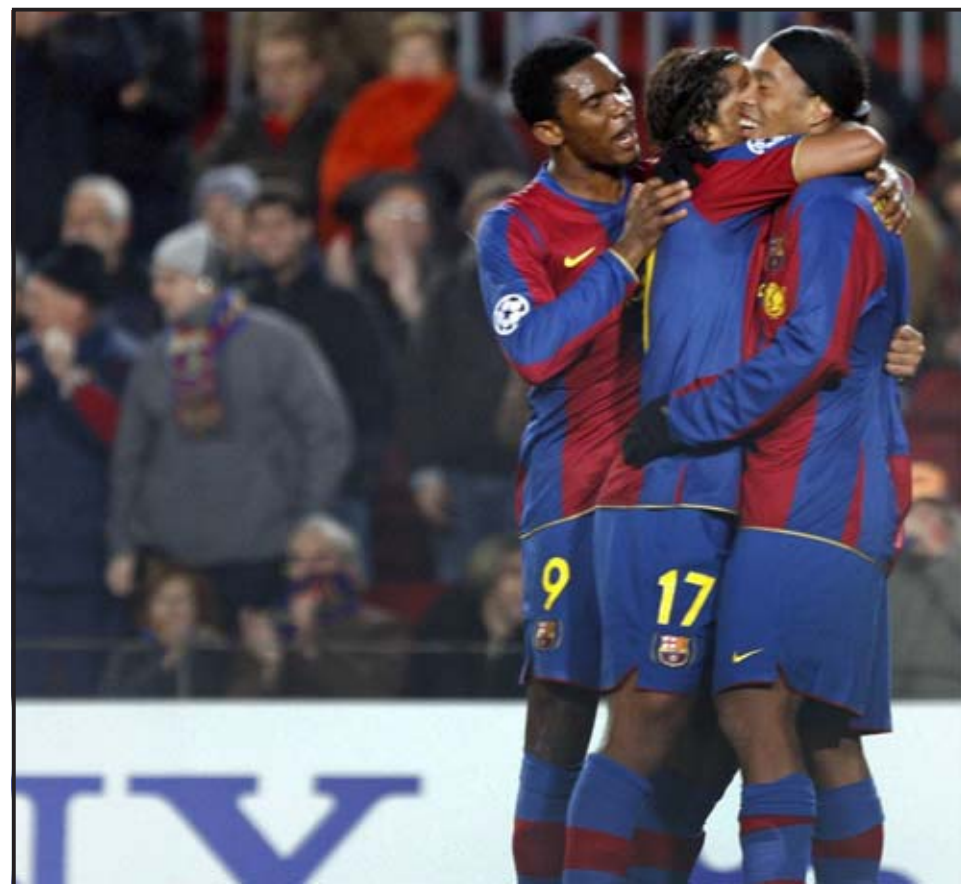
BARCELONA (ESPAÑA). El delantero mexicano del F.C. Barcelona, Giovanni Dos Santos Ramírez (centro) celebra con sus compañeros, el delantero brasileño, Ronaldo de Assis Moreira 'Ronaldinho' (dcha.) y el camerunés, Samuel Eto'o, el gol que convirtió ante el Stuttgart, durante el partido de la octava jornada de la Liga de Campeones.

La legión mexicana la lideran Rafael Márquez (Barcelona), Carlos Salcido (PSV Eindhoven), Ricardo Osorio y Pavel Pardo (Stuttgart), Nery Castillo (Shaktar Donetsk de Ucrania), Andrés Guardado (Deportivo La Coruña), Aarón Galindo (Frankfurt Eintrach), Guillermo Franco (Villarreal). Otros mexicanos están a la espera de un llamado para hacer maletas e instalarse en Europa, como el portero Guillermo Ochoa (América) y el defensa Francisco Rodríguez (Chivas).