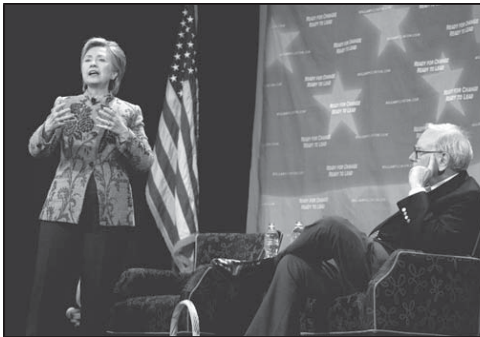
SAN FRANCISCO (EE.UU.). La precandidata presidencial demócrata Hillary Clinton (izqda.), habla en San Francisco en un evento público que reúne fondos para su campaña presidencial. Al evento asistió el multimillonario Warren Buffet (dcha.) como moderador y coordinador de donaciones para la campaña.

Según datos del Partido Demócrata de Iowa, en éste estado están registrados para votar unos 20.000 hispanos, aunque la Oficina de Asuntos Hispánicos de Iowa calcula que ejercerán su derecho al voto un 20 por ciento. Uno de los estrategias de la campaña de