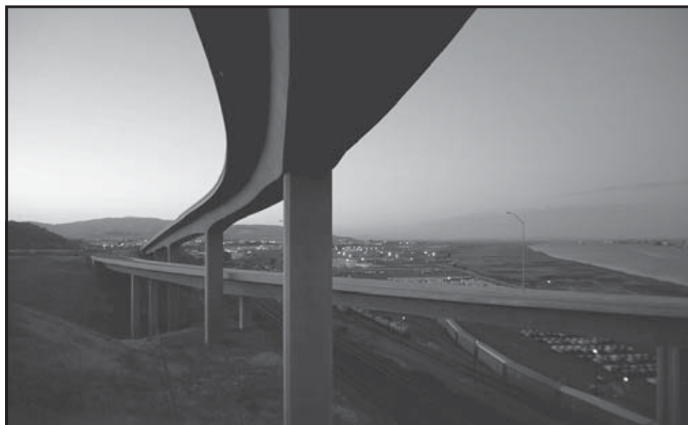
Foto de archivo del puente Benicia-Martinez, que tuvo importantes reformas en el 2007.

Además de la versión en español, la encuesta en línea está disponible en chino e inglés.