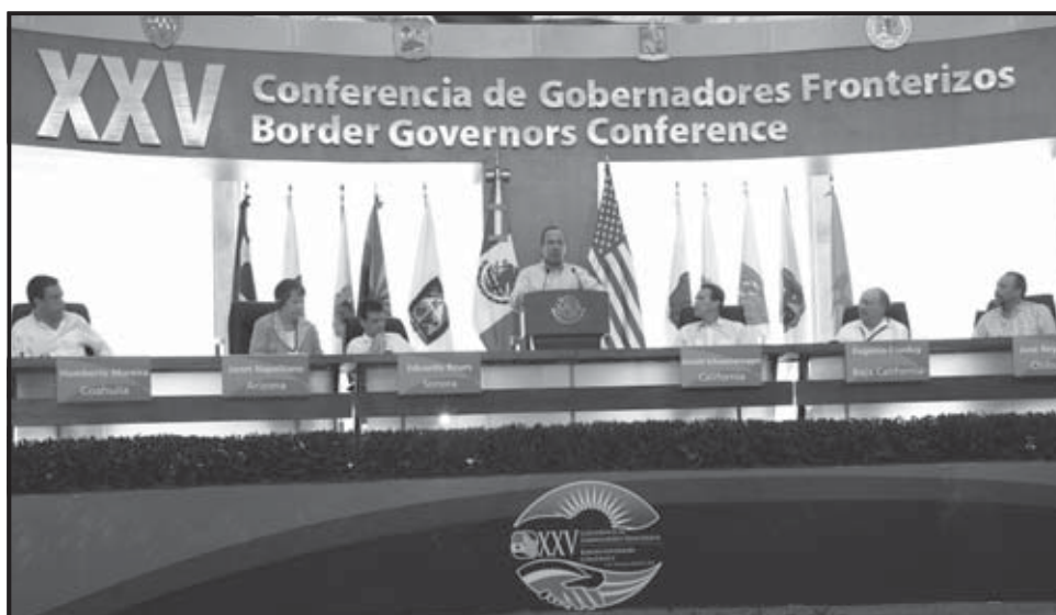
PUERTO PEÑASCO (MÉXICO). De izquierda a derecha: el gobernador del estado mexicano de Coahuila, Humberto Moreira; la gobernadora de Arizona (EE.UU.), Janet Napolitano; el gobernador del estado mexicano de Sonora, Eduardo Bours; el presidente de México, Felipe Calderón; el gobernador de California, Arnold Schwarzenegger; el gobernador del estado mexicano de Baja California, Eugenio Elorduy, y el gobernador del estado mexicano de Chihuahua, José Reyes Baeza, durante la XXV Conferencia de Gobernadores Fronterizos en Puerto Peñasco, Sonora.

El presidente de México, Felipe Calderón, exigió nuevamente a los Estados Unidos que combata el narcotráfico, el consumo de drogas y el contrabando de armas, e instó al Congreso estadounidense a retomar el debate sobre la reforma migratoria. Calderón indicó que su país ha “enfrentado con toda la fuerza del Estado a la delincuencia organizada”, pero sostuvo que se trata de “un problema que va mucho más allá de nuestras fronteras y que de hecho tuvo en su momento como principal causa el consumo de drogas en Estados Unidos”.