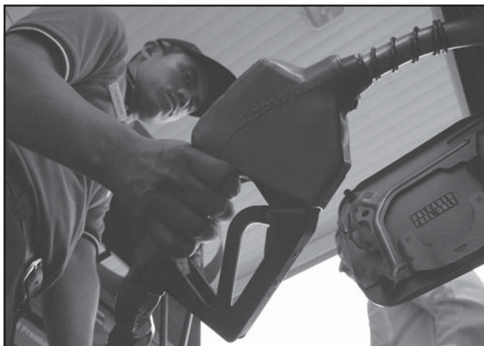
SAN SALVADOR (EL SALVADOR). Un trabajador de una gasolinera suministra combustible a un automóvil en la capital de El Salvador, donde se realizó el Segundo Seminario Latinoamericano y del Caribe de Biocombustibles en el que participan delegados de 26 países de América Latina y el Caribe, los cuales coincidieron en que los biocombustibles son la mejor alternativa para frenar la dependencia del petróleo y reducir los gastos de energía.

El director del IICA manifestó que con los precios del petróleo y su tendencia al alza "será cada vez más difícil cubrir la demanda mundial", sostenible por 40 años más. Brathwaite, de Barbados, dijo que ya se registran problemas medioambientales por el calentamiento global, causado en gran parte por el incremento de gases provenientes del consumo de gasolina y diesel. "Muchos países que no tienen petróleo deben gastar parte importante de su presupuesto en importar combustibles fósiles cuando existe el potencial de producir en sus propios países, a través de transformar biomasa, biocombustibles a partir de cultivos como caña de azúcar, palma africana, soja, higuero y otros".