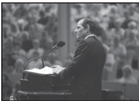
Gobernador del estado de Nueva York, Eliot Spitzer, en una de sus apariciones públicas.

Legisladores y activistas aseguraron que otorgar licencias de conducir hace justicia a miles y miles de inmigrantes que trabajan, que aportan a la economía del estado y que sólo buscan mejorar la calidad de vida de sus familias. Argumentaron que poseer el documento aumenta la seguridad