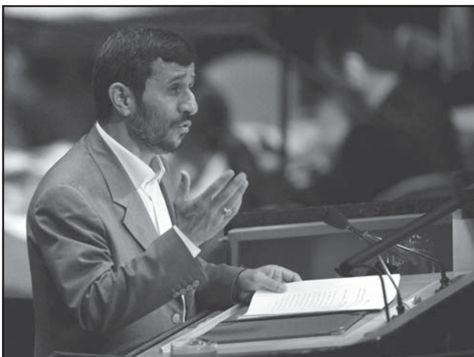
NUEVA YORK (EE.UU.). El presidente de Irán, Mahmoud Ahmadinejad, interviene en el Debate General de la 62 sesión de la Asamblea General de Naciones Unidas, en la sede de esta organización en Nueva York.

Irán y el OIEA acordaron en agosto pasado un “plan marco” para aclarar cuestiones pasadas del programa nuclear iraní hasta finales de año. El plan nuclear ha sido criticado por Estados