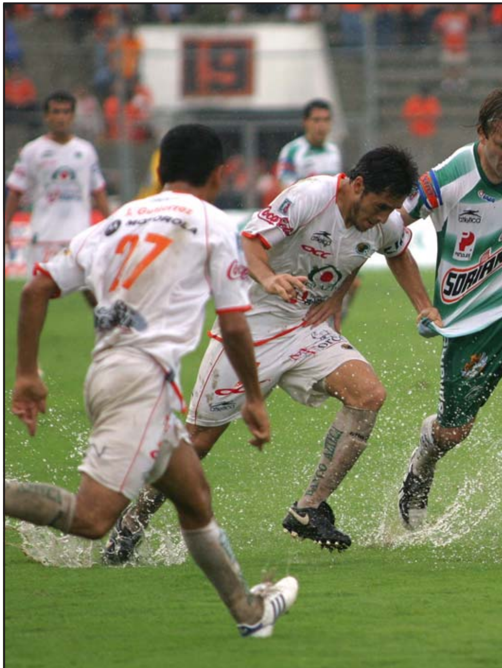
TUXTLA GUTIÉRREZ, CHIAPAS (MÉXICO).- El delantero argentino del Santos, Matías Vuoso (2 dcha.) disputa el balón con los defensas del Jaguares de Chiapas, durante partido correspondiente a la jornada 10 del Torneo Apertura 2007 celebrado en el estadio Víctor Manuel Reyna en el estado mexicano de Chiapas.

zona de clasificación a la Liguilla, con 14 unidades, dos juegos ganados, cinco empatados y tres perdidos.