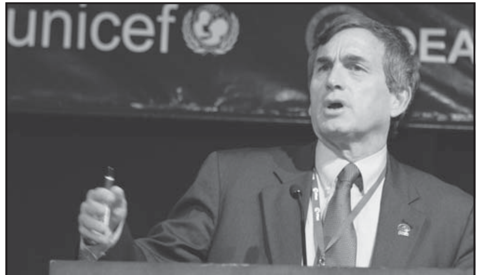
ASUNCIÓN (PARAGUAY). El director ejecutivo de Plan, Tom Miller, pronuncia un discurso durante la apertura de la "I Conferencia Regional Latinoamericana sobre el Derecho a la Identidad y Registro Universal de Nacimiento", promovida por la Organización de Estados Americanos (OEA) y el Fondo de las Naciones Unidas para la Infancia (UNICEF).

El ministro paraguayo de Justicia y Trabajo, Derlis Céspedes, dijo que la falta de registro "coloca al niño o a la niña en una situación de extrema vulnerabilidad y les genera la imposibilidad de recibir protección y beneficios del Estado. El déficit en el registro (...) es un problema tangible para todos los países subdesarrollados y sus consecuencias afectan tanto a connacionales como inmigrantes", explicó Céspedes, al advertir