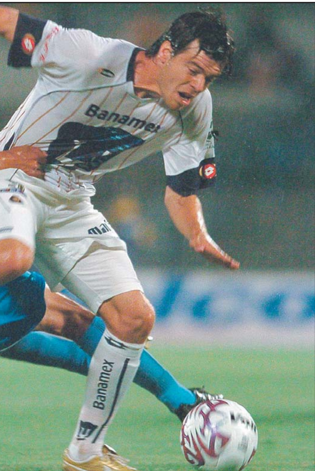
da.) del Puebla, en el juego correspondiente a la quinta jornada del Torneo Apertura del fútbol mexicano realizado en el estadio "México