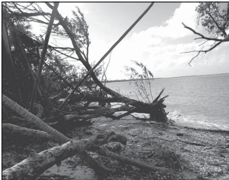
SIAN KA'HAN (MÉXICO). Aspecto de la vegetación en una playa de la reserva de la biosfera de Sian Ka'Han, en el estado mexicano de Quintana Roo, luego del paso del huracán “Dean” que golpeó al país en dos ocasiones, primero en el Caribe y después en el Golfo de México, afectando 2,3 millones de hectáreas forestales.

México se recupera todavía del impacto de “Dean”, que penetró con categoría 5 en la península de Yucatán, en el sureste, aunque finalmente no causó daños de magnitud en las zonas turísticas del Caribe mexicano. Al día siguiente, el huracán volvió a tocar las