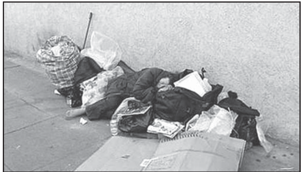
Aumenta la brecha entre pobres y ricos en California.

Los ingresos de los mejor pagados aumentaron más del 18 por ciento en el período estudiado, mientras que los ingresos de nivel medio sólo crecieron 1,3 por ciento. ●