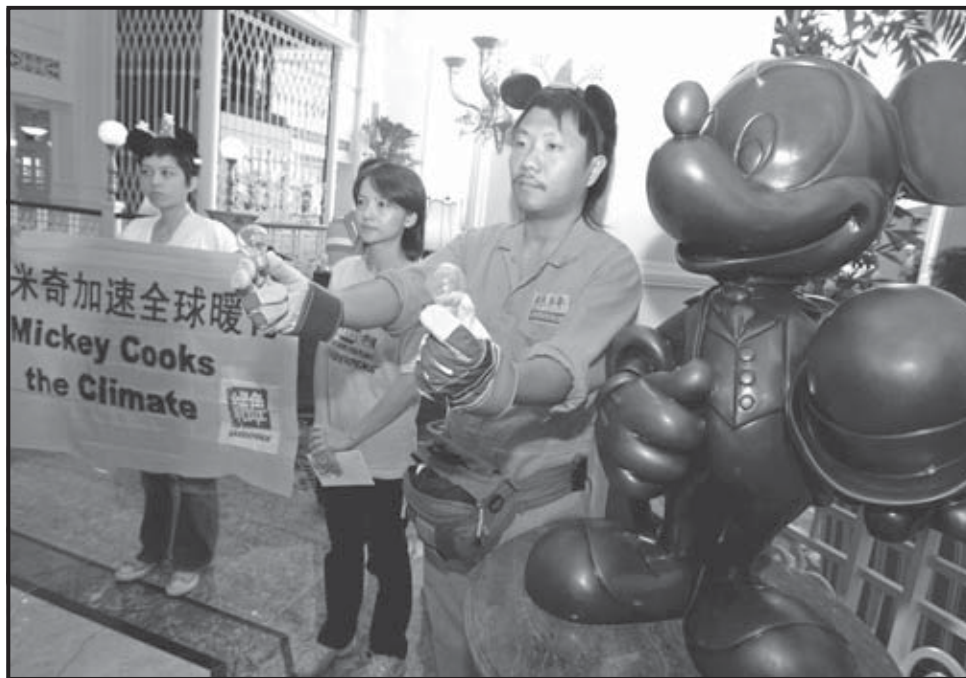
HONG KONG (CHINA). Un grupo de activistas de Greenpeace muestran dos bombillas después de haberlas reemplazado por dos fluorescentes de bajo consumo, en el hotel Disneyland de Hong Kong, China. Greenpeace fue llamada por Disney para que sustituyera todas sus bombillas por las que ahorran energía, un hecho que contribuye a disminuir el cambio climático.

Según los informes presentados este año por los científicos del Panel Intergubernamental sobre Cambio Climático (IPCC), la acción del