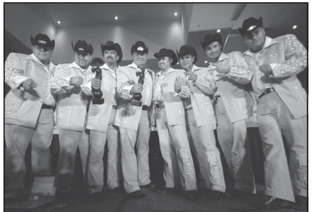
VERACRUZ (MÉXICO). Los integrantes del grupo mexicano de música popular, K-Paz de la Sierra, muestran sus galardones por álbum y canción del año en el género popular durante la entrega de premios Oye, a lo "Mejor de la Música", en el puerto mexicano de Veracruz.