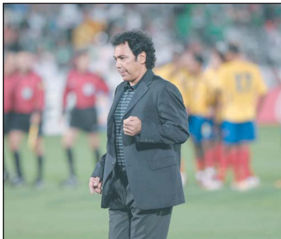
DENVER (EE.UU.). Hugo Sánchez, técnico de la selección mexicana camina fuera de la cancha durante el medio tiempo del juego amistoso disputado ante Colombia, en el Dick's Sporting Goods Park en Denver, Colorado.

México se prepara actualmente para las eliminatorias olímpicas de Pekín 2008 de la Confederación Norte, Centroamericana y del Caribe (CONCACAF) que se celebrarán a principios de 2008 en Estados Unidos.