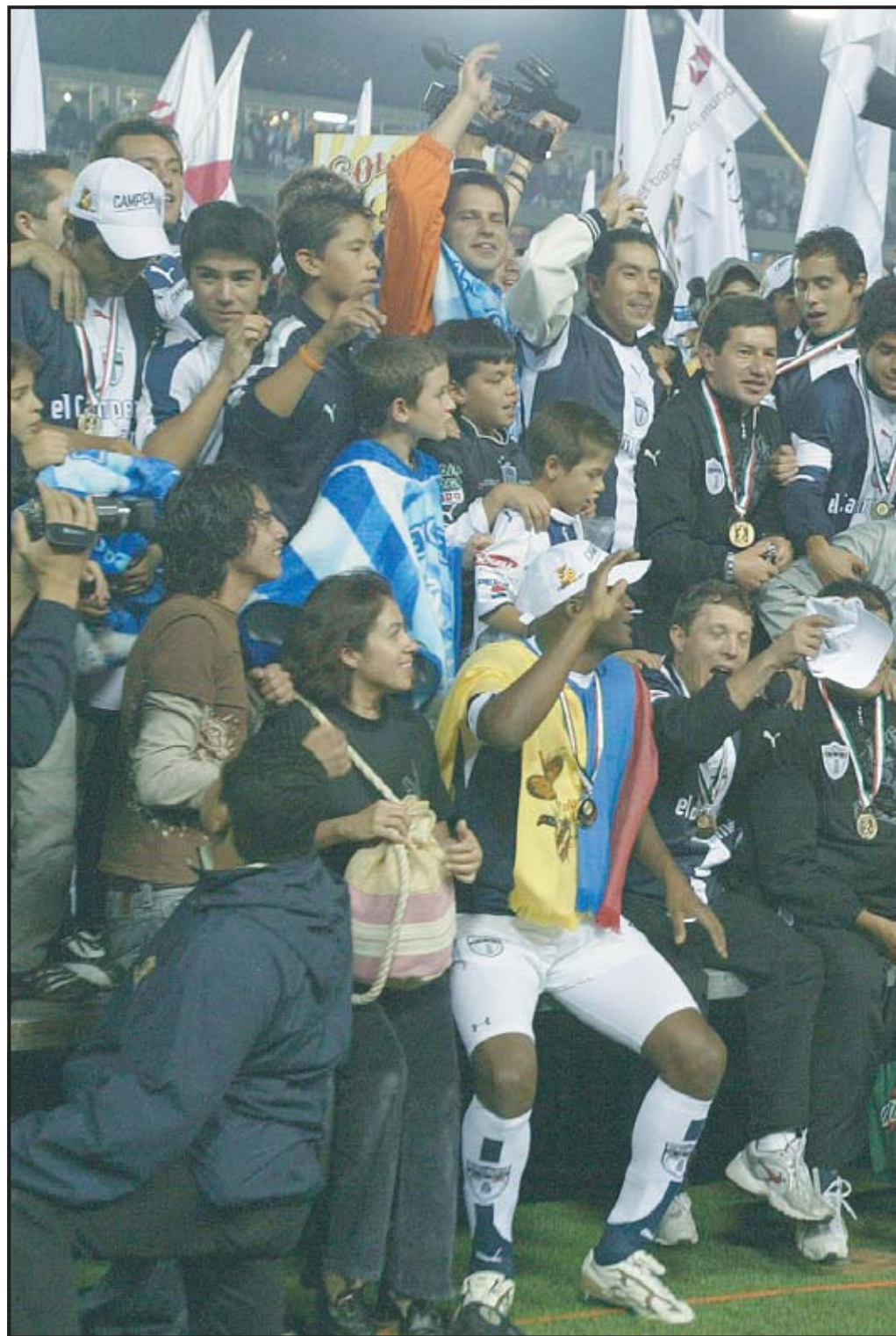
PACHUCA (MÉXICO). Los jugadores del Pachuca celebran el título del Torneo Clausura 2007 del fútbol mexicano. Otro logro para el Pachuca

campeonato mexicano Clausura 2007. La mayor de las virtudes de Enrique Meza en esta cadena de éxitos, -y todos se lo alaban en el fútbol mexicano- ha sido la humildad frente a los triunfos. Y no parecen existir grandes secretos en el éxito porque el equipo de Meza está visible en la cancha con jugadores que ejecutan las órdenes sin perder la creatividad y que juegan sin complicaciones.