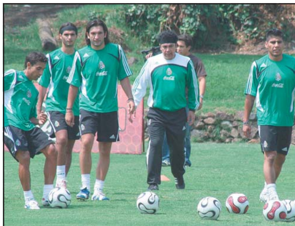
CIUDAD DE MÉXICO (MÉXICO). Jugadores de la selección mexicana de fútbol encabezados por su técnico, Hugo Sanchez (centro), durante su entrenamiento en las instalaciones del Centro de Alto Rendimiento de Ciudad de México, dentro de su preparación para los juegos amistosos y los torneos de junio y julio.

Hugo Sánchez reiteró que el seleccionado mexicano respetará a los rivales y no caerá en excesos de confianza, todo su empeño lo pondrá en tener una buena forma física y táctica para jugar "con seriedad los amistosos y mentalizarse en la competición".