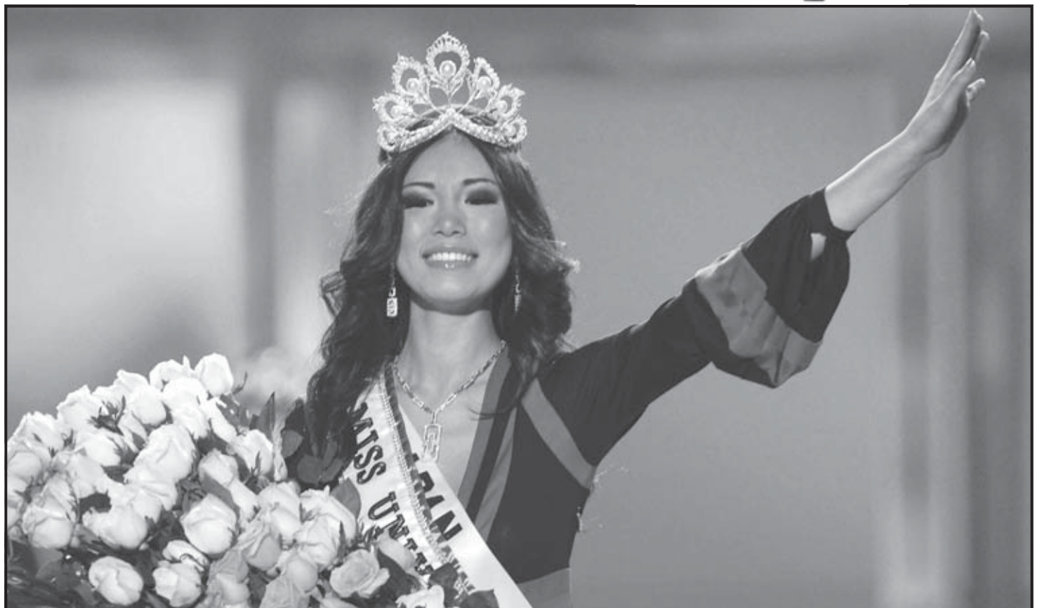
CIUDAD DE MÉXICO (MÉXICO). La candidata de Japón, Riyo Mori, saluda emocionada a los asistentes del Auditorio Nacional Ciudad de México, después de ser coronada como nueva Miss Universo.

Entre las celebridades del jurado estuvieron la ex Miss Universo, Dayanara