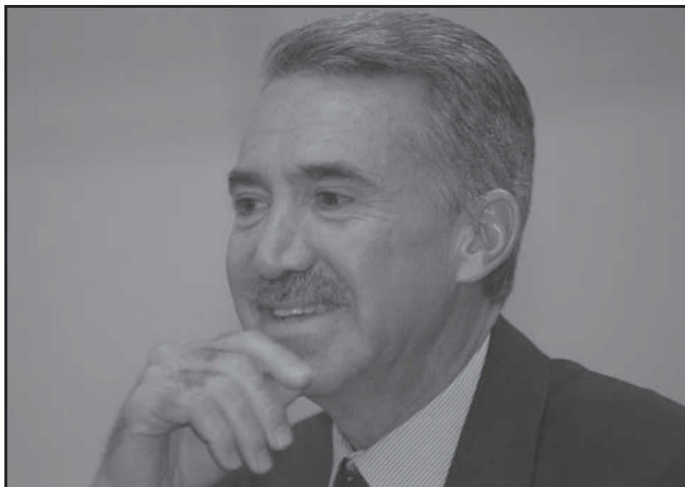
CIUDAD DE MÉXICO (MÉXICO). El ex aspirante del Partido Revolucionario Institucional (PRI) a la presidencia de México, Roberto Madrazo, se dirige a los corresponsales extranjeros durante una rueda de prensa en un hotel de Ciudad de México. Madrazo criticó el plan de combate al narcotráfico del mandatario Felipe Calderón, al que a su juicio le falta más trabajo de inteligencia y control en las extradiciones de capos.

Tercero en las pasadas elecciones presidenciales con 9,2 millones de los 41 millones de votos emitidos, Madrazo se