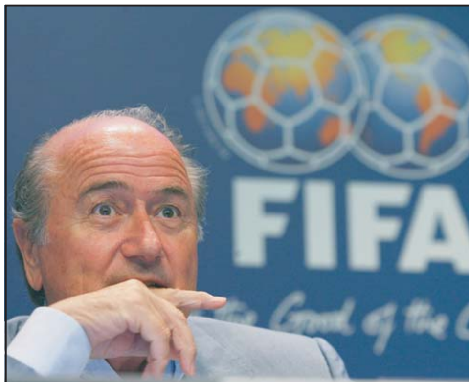
ZÚRICH (SUIZA). Fotografía de archivo del presidente de la FIFA, Joseph Sepp Blatter, en la sede central del organismo en Zúrich, Suiza. Según dijo Blatter en un programa de la BBC, hay varios países preparados para organizar el Mundial de Fútbol de 2010 si Sudáfrica no cumple los plazos de organización.

El año pasado, Blatter expresó recelo y dudas ante la falta de construcción y de obras de renovación en los diez estadios sudafricanos en los que se celebrarán los partidos del Mundial dentro de tres años.