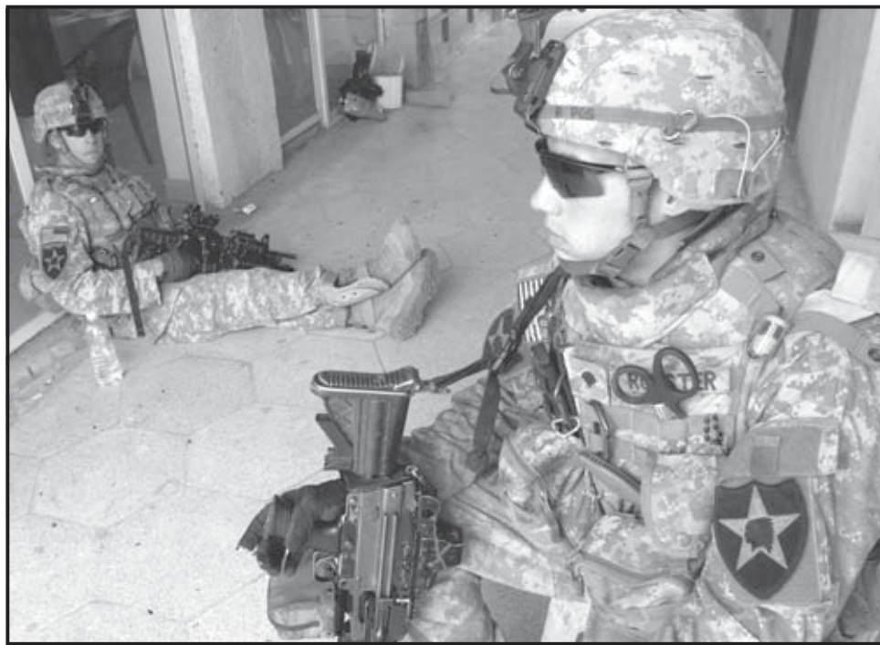
BAGDAD (IRAQ). Soldados estadounidenses durante una operación de registro en el barrio Mansour de Bagdad. Tres militares estadounidenses fueron procesados por un juez español.

El juez Pedraz, afirma que los imputados "sabían y conocían" que el hotel Palestina estaba situado en zona civil y ocupado por periodistas, "sin que conste acreditada la existencia de amenaza alguna" contra ellos ni