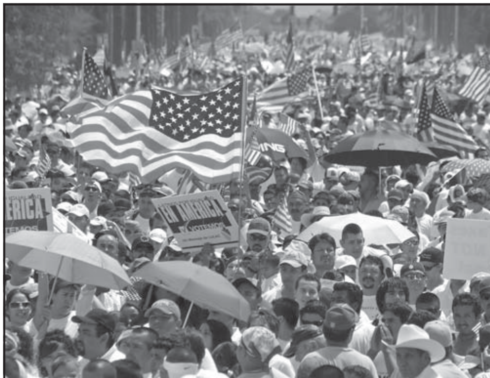
PHOENIX (EE.UU.). Miles de personas marcharon en Phoenix, Arizona, pidiendo igualdad de derechos para los inmigrantes, una reforma migratoria, y la detención de redadas y deportaciones.

Grupos de personas partieron desde la Iglesia Metodista Unida Adalberto, en el noroeste de Chicago, donde permanece refugiada la activista indocumentada mexicana Elvira Arellano. A ese y otros grupos se les unieron