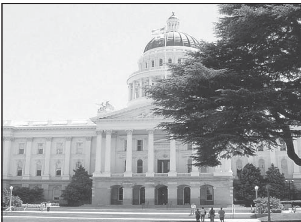
SACRAMENTO (EE.UU.). Edificio del Capitolio, sede de la legislatura del Estado de California.

La reducción que Hill propone aseguraría