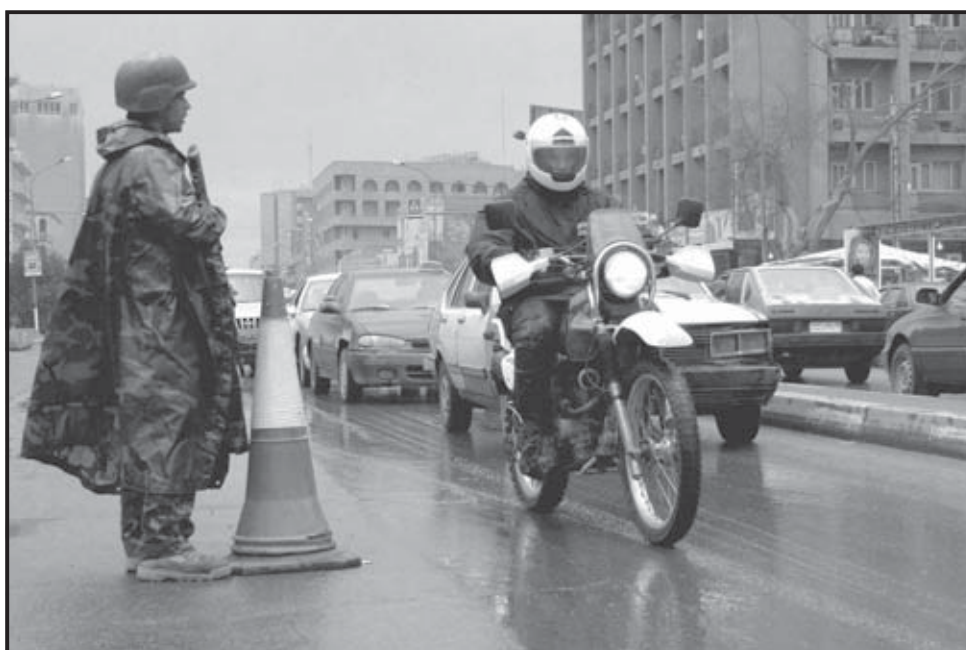
BAGDAD (IRAK). Un soldado iraquí vigila en un puesto de control en Bagdad. El ejército iraquí aumentó la red de puestos de control montados en la capital ante el aumento de la violencia. Miles de latinoamericanos son mercenarios en ese país e integran parte de la seguridad..

Algunos países latinoamericanos forman parte de la Convención Internacional de Utilización, Financiación y Entrenamiento de Mercenarios, que sanciona con penas de cárcel en el país a los que incurran en estas prácticas. La Convención establece como delito reclutar,