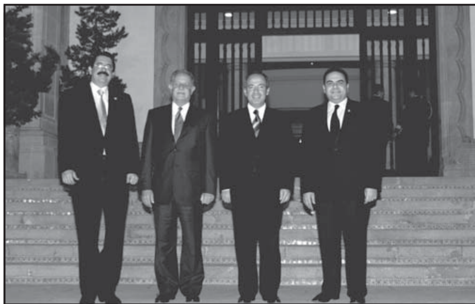
CIUDAD DE MÉXICO (MÉXICO). El presidente de México, Felipe Calderón Hinojosa (segundo dcha.) recibe a sus homólogos; Manuel Zelaya Rosales, de Honduras (izqda.) Oscar Berger Perdomo de Guatemala (segundo izqda.) y Antonio Saca, de El Salvador (dcha.) en la residencia presidencial de Los Pinos, en la Ciudad de México (México), donde los mandatarios conversaron, entre otros temas, sobre la reforma migratoria y la próxima Cumbre del Plan Puebla Panamá (PPP).

antes de que las efervescencias" de la elección presidencial estadounidense del 2008 "pudieran interferirla", dijo a la prensa Óscar Berger. Los gobiernos mexicano y centroamericanos están "apostando a promover la reforma a la ley de migración integral", un reto que en la actual coyuntura "es una oportunidad que no podemos perder", agregó Berger en alusión a la inminente visita del presidente George W. Bush a Guatemala y México.