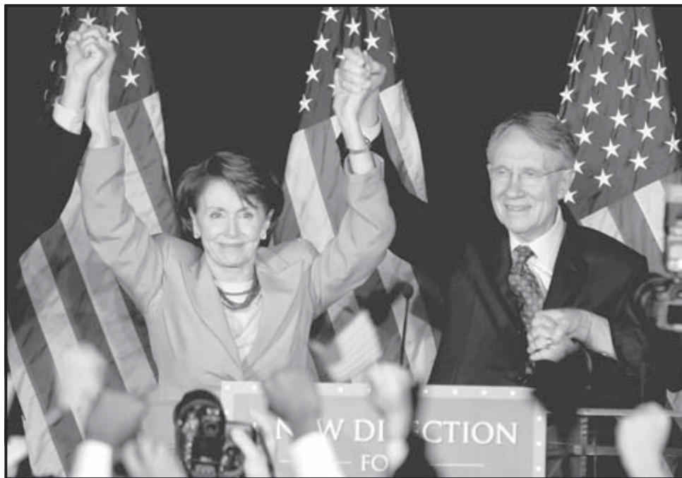
WASHINGTON (EE.UU.). La representante Nancy Pelosi de California (izqda.), y el senador Harry Reid de Nevada, en una fiesta en el Hotel Hyatt Regency de Washington.

El objetivo de Reid es que el proyecto de ley, sea aprobado por el Comité Judicial del