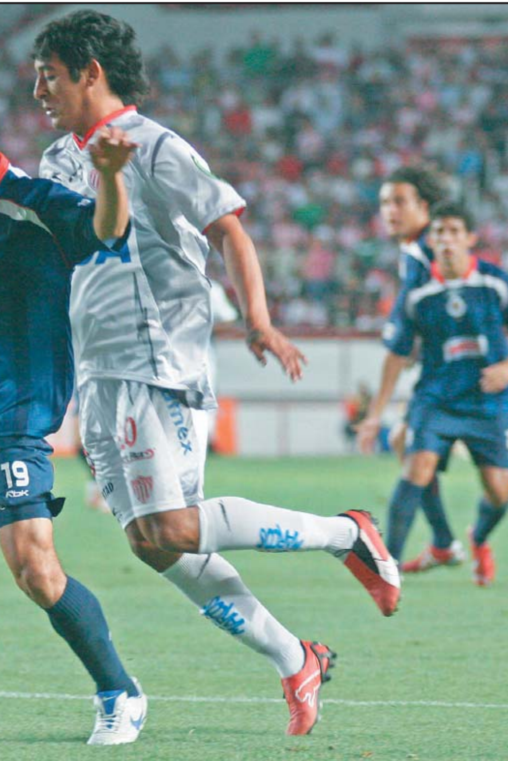
go realizado en el estadio Victoria de la ciudad de Aguascalientes por el torneo Clausura 2007 del fútbol mexicano.

vencieron 2-1 al Monterrey. El Morelia del chileno Marco Antonio Figueroa, superó 2-1 al Toluca del argentino Américo Gallego, que además de llegar a siete jornadas sin poder ganar, ha sufrido su primera derrota. Rafael Márquez Lugo y Mariano Trujillo fueron los que ejecutaron al Toluca, que había conquistado su gol por medio de Carlos Esquivel. El Cruz Azul venció 1-0 a los Pumas de la UNAM con un gol de Miguel Sabah, y se colocó en la tabla con 13 puntos, por debajo