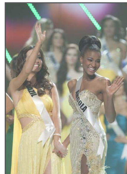
SAO PAULO (BRASIL). La representante de Angola, Leila Lopes (dcha.), y de Brasil, Priscila Machado (izqda.), saludan al público mientras esperan la elección de las cinco finalistas de Miss Universo 2011, en la casa de espectáculos Credicard Hall en Sao Paulo. Lopes ganó el concurso y es la nueva Miss Universo.

Lopes, expresó su admiración por Brasil, país anfitrión de la sexagésima edición del Miss Universo en la que fue coronada como la más bella del mundo y que comparte con Angola la lengua portuguesa, y dijo que desde niña ha estado en "contacto" con el gigante sudamericano "a través de las telenovelas".