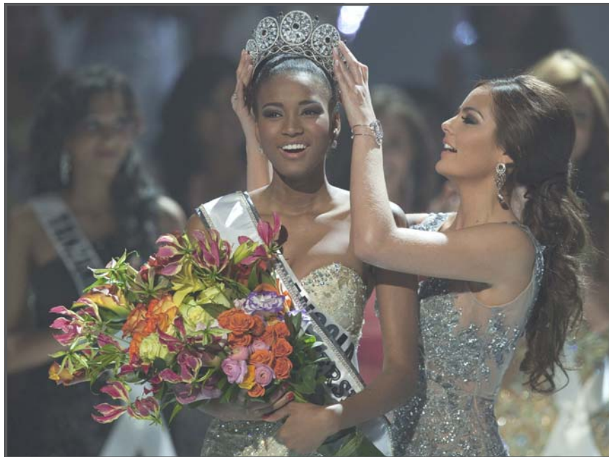
SAO PAULO (BRASIL). La representante de Angola, Leila Lopes (izqda.), es coronada como Miss Universo 2011 por su antecesora la mexicana Ximena Navarrete, en la ceremonia de cierre del certamen en la casa de espectáculos Credicard Hall, en Sao Paulo.

Lopes respondió que se sentía "muy satisfecha" con su apariencia y que se veía a sí misma como una "chica muy bonita por