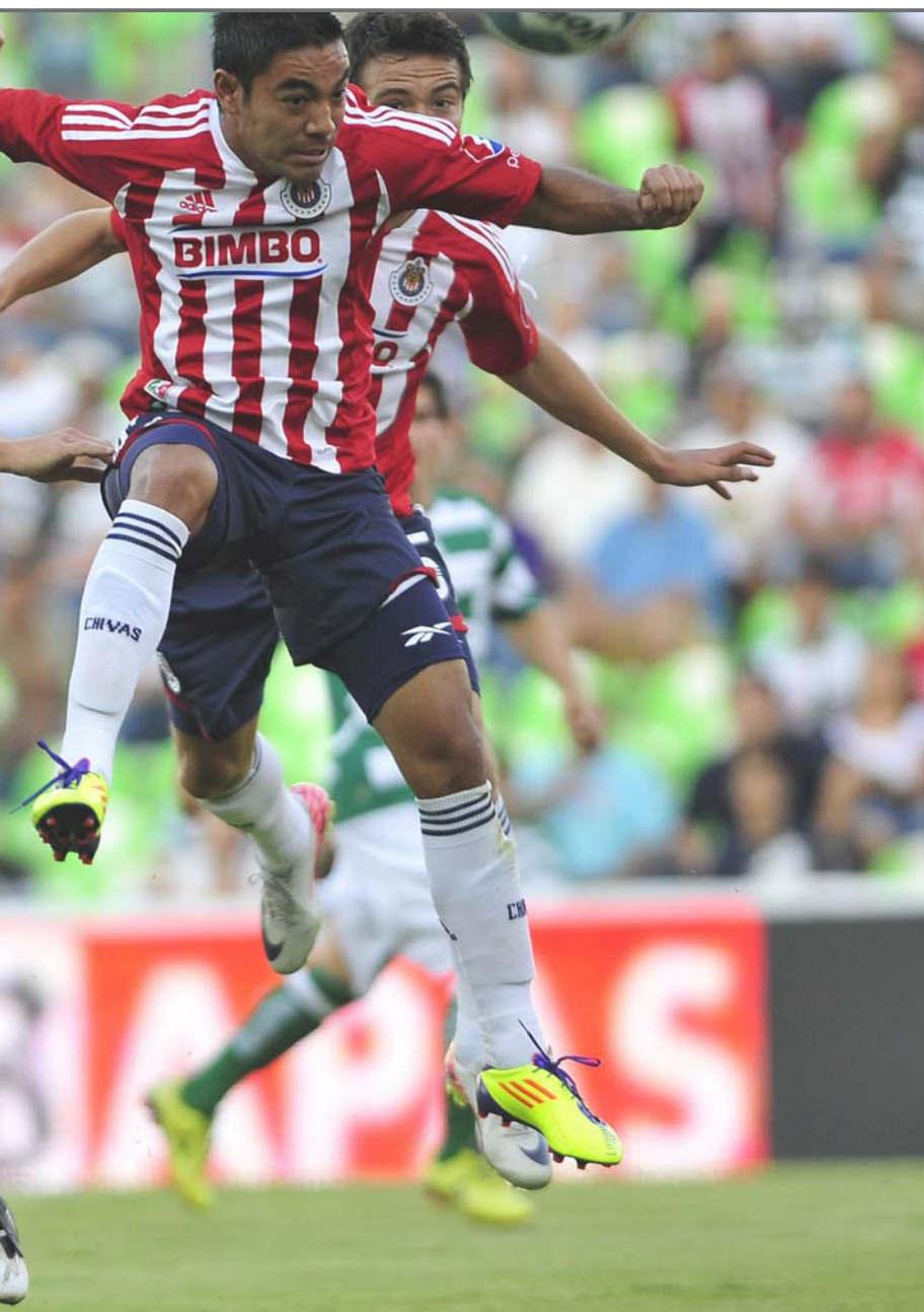
de Santos, durante el partido correspondiente a la jornada 8 del Torneo Apertura 2011 celebrado en el estadio Corona de