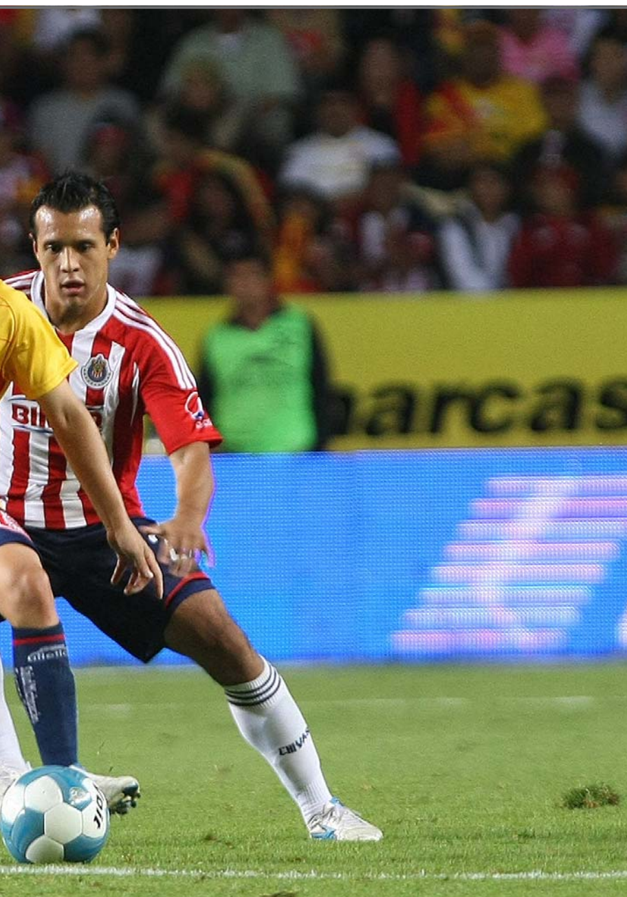
Chivas, durante un partido correspondiente a la jornada 5 del Torneo Apertura 2011 del fútbol mexicano, celebrado en el