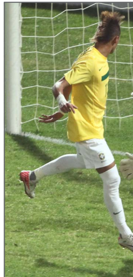
CORDOBA (ARGENTINA). El jugador de la selección de Brasil durante el último partido del grupo B de la Copa América 2011.