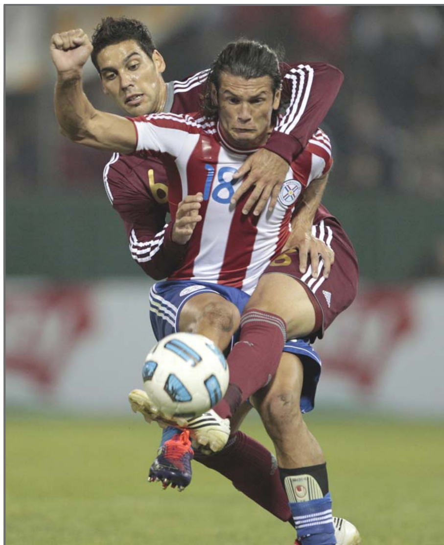
SALTA (ARGENTINA). El jugador de la selección de Venezuela Gabriel Cichero (detrás), disputa el balón con su rival Nelson Haedo Valdez (dcha.) de Paraguay, durante el partido disputado en la ciudad de Salta por el grupo B de la Copa América Argentina 2011.

Pero todavía el ritmo goleador de la competición está muy por debajo del registro de 2007 en Venezuela, donde se lograron 86 goles con una media de 3.3 tantos por partido.