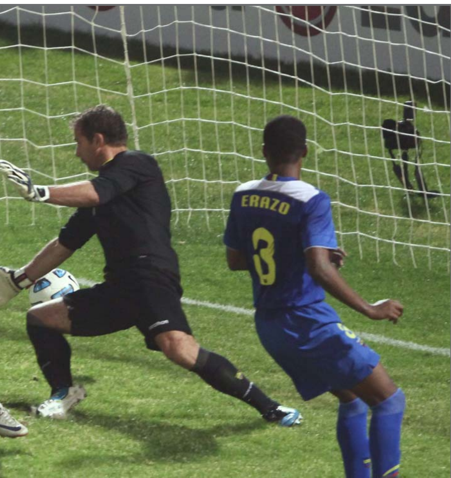
Brasil Neymar (izqda.), convierte su gol ante la defensa de Marcelo Elizaga (centro) y Fricson Erazo (dcha.) de Ecuador, 2011, en la ciudad de Córdoba.

y Diego Forlán, así como el técnico Oscar Washington Tabárez. Dos goles conseguidos por Forlán, uno espectacular de Pablo García y otro de Cristian Rodríguez dieron la victoria a la selección uruguaya en Venezuela 2007.