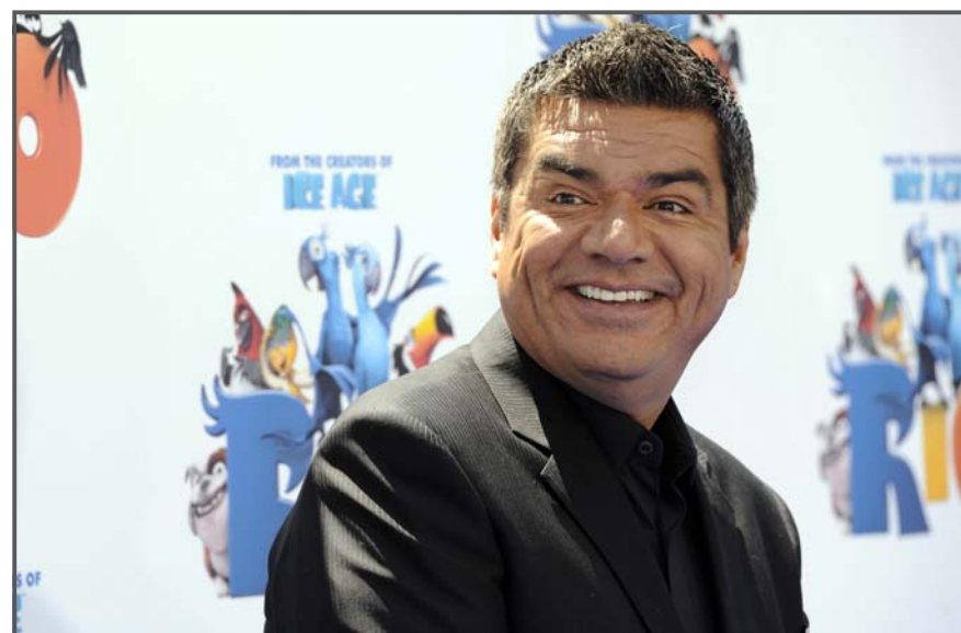
HOLLYWOOD, CALIFORNIA (EE.UU.). El actor estadounidense miembro del reparto, George Lopez, llega al estreno de la película “Rio” en el Grauman’s Chinese Theatre de Hollywood, California.