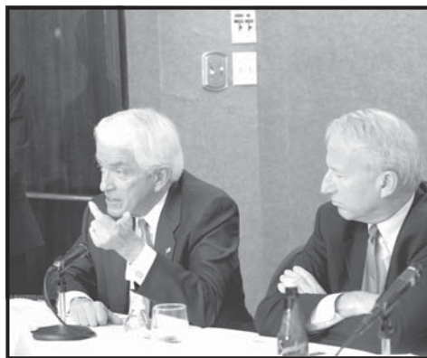
El presidente de la Cámara de Comercio, Tom Donohue, en conferencia de prensa con grupos de trabajadores, y organizaciones, en una exhortación al Congreso para adoptar una comprensiva reforma migratoria.

Algunas Cámaras de Comercio Hispánicas del país se