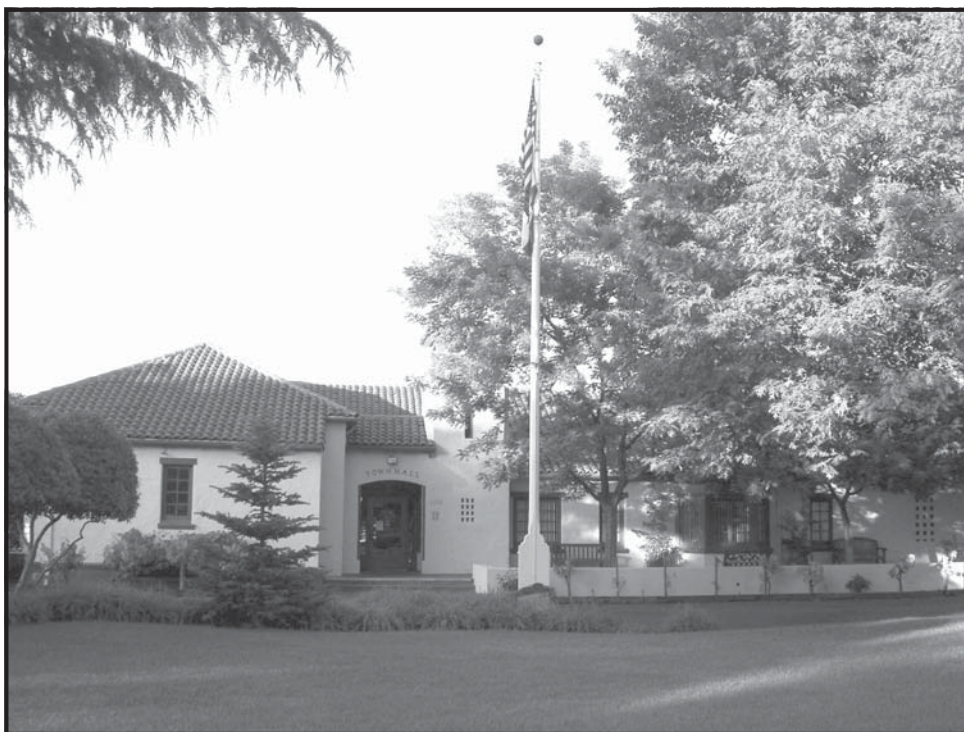
Town Hall de Yountville. Edificio del gobierno de la ciudad de Yountville.

Carlson manifestó que, hay un "90 por ciento" de posibilidades para que él se mueva, y que deberá decidir al respecto y tomar "una decisión firme y final" a mediados de febrero.