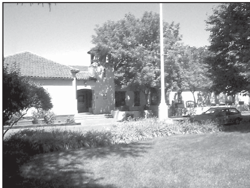
Otra perspectiva del edificio de gobierno de la ciudad.

El Alcalde de Yountville, se ha destacado en la guía y desarrollo de varios proyectos, ha entregado su mejor labor para el desarrollo y crecimiento de la ciudad. ●