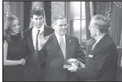
WASHINGTON DC (EE.UU.). El demócrata de Nueva Jersey Robert Menéndez (centro), acompañado por sus hijos, toma posesión de su nuevo cargo como senador ante el senador por el estado de Alaska, Ted Stevens (derecha).

La ceremonia de juramentación se llevó a cabo en Washington, y la toma del juramento la realizó el senador representante de Alaska, Ted Stevens,